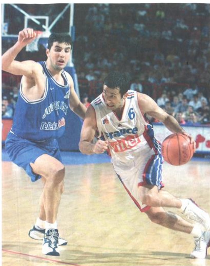
PARIS, POB, 3 SEPTEMBRE 1999. – Lors du match pour la troisième place de l'Euro, à domicile, Antoine Rigaudeau (ici face à Dejan Bodiroga) s'incline avec les Bleus contre la Yougoslavie (74-62).

DISTINCTIONS PERSONNELLES : MVP français en 1991, 1992, 1993, 1994 et 1996. Entré au NBA Hall of Fame en 01.