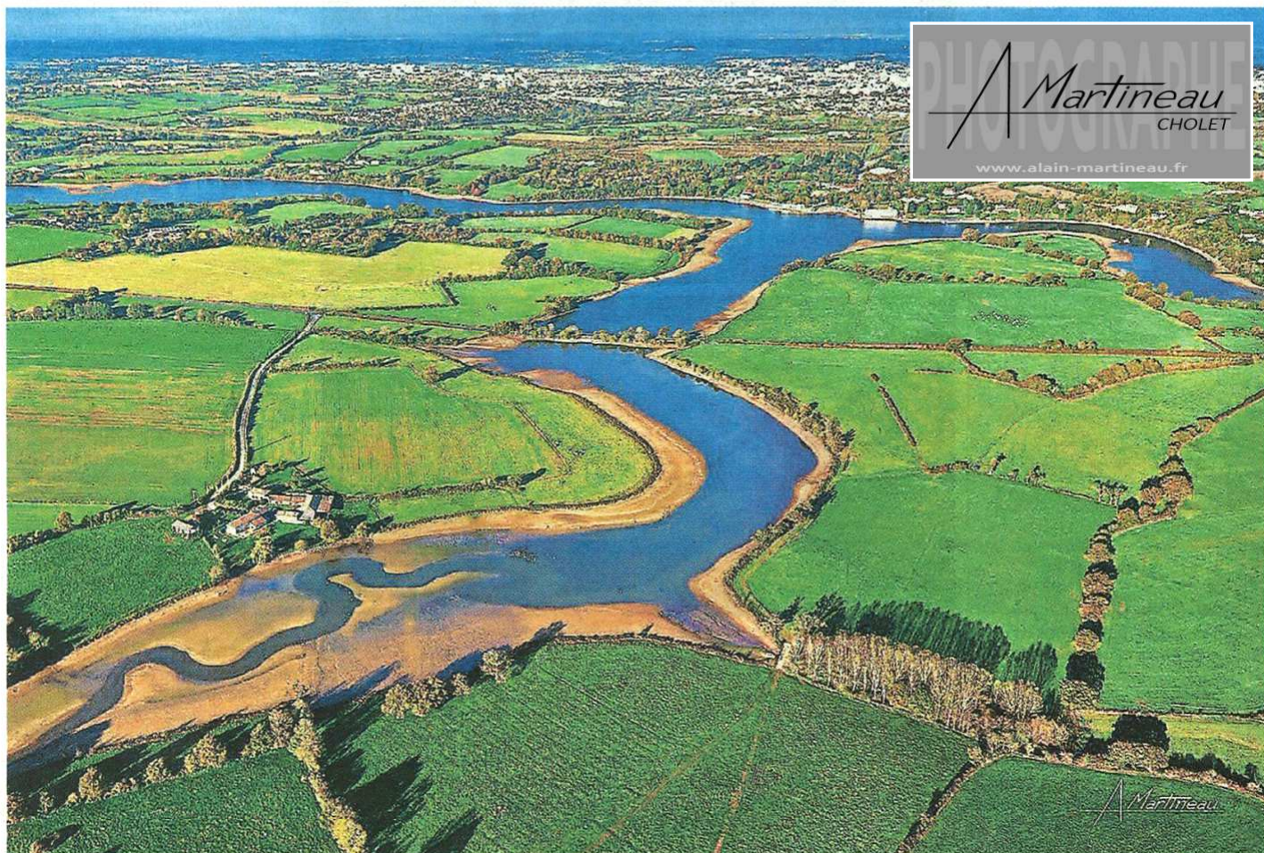
« Méandres de Ribou ». Au tout premier plan, la Moine juste après le barrage du lac du Verdon. Elle suit son cours pour devenir le lac de Ribou, juste coupée par la petite route qui conduit à La Tessoualle. On aperçoit la route qui mène de la ville au lac de Ribou, au bord de laquelle se construit le quartier du Val de Moine.

La ville vue du ciel. Tout l'été, le photographe Alain Martineau nous montre Cholet sous une autre perspective. Et décrypte les images qu'il a prises en hélicoptère.