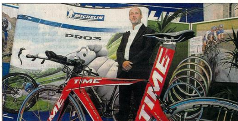
A la Foire de Cholet, Michelin met en valeur les deux roues

Ces pneus de motos et de vélos sont fabriqués dans des usines du groupe en Europe ou alors en Asie. Car le site de Cholet, où travaillent 1 500 personnes, est dédié à la fabrication des pneus de camionnettes et de 4 X4. Une grosse partie des 15 000