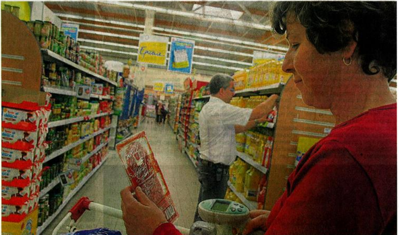
Après Hyper U, à Chemillé (notre photo), c'est au tour de Géant, à Cholet, d'adopter les zappettes. Un système qui permet aux clients d'éditer sa facture en faisant ses courses. Un gain de temps.

Un an après. Le client édite sa facture en remplissant son chariot. Lancé à Hyper U, le système gagne Géant. Qui s'est doté de 170 zappettes.