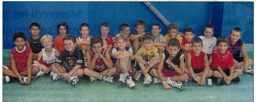
Des débutants qui rêvent de jouer dans la grande équipe

Le souci de l'association de Cholet Basket, est de mettre en place une disponibilité d'horaires, avec des cours dirigés par des personnes compétentes. De ce