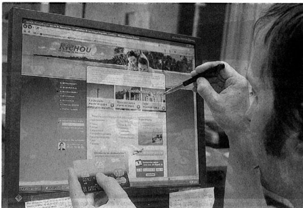
Richou vient d'ouvrir un site de réservations en ligne. Une initiative qui lui permet de densifier son offre et d'élargir sa clientèle.

Non. Et les deux activités sont même complémentaires. Avec les agences, on offre un service après-vente, des garanties, des conseils. Le client sait qu'il y a quelqu'un derrière. Et on continue d'ailleurs d'ouvrir des points de vente.