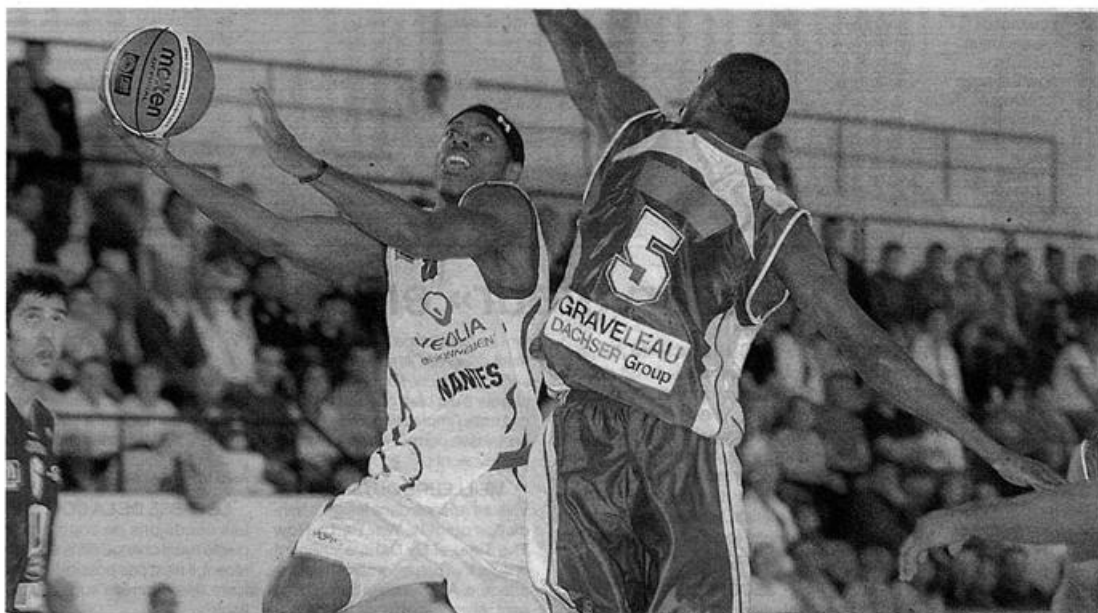
Hollins et les Nantais ont été mis en difficulté par la défense choletaise. À trois semaines de la reprise de la saison de Pro B, les Nantais ont encore du pain sur la planche.

Difficile de gagner dans ces conditions ! La petite avance consentie avant la pause (33-27, 19 e ) ne parvenait donc pas à mettre sous l'étéignoir les joueurs d'Erman Kunter. Sous l'impulsion de Mokongo au retour des vestiaires (9 pts en 4'), Cholet, toujours sans ses internationaux français et Beaubois, faisait un écart mérité (44-54, 28 e ).