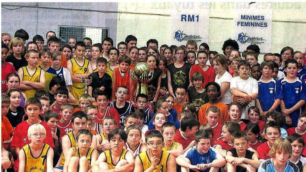
Les 180 collégiens autour du trophée de Championnat de France remporté par Cholet Basket et exposé à la salle des sports.

Le Comité départemental de basket de Maine-et-Loire organisait, mercredi, un tournoi des sections sportives locales (SSL) de basket réunissant 180 collégiens des classes de 6 e et 5 e , issus de onze collèges.