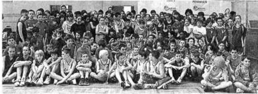
L'ensemble des onze sections de basket des collèges de Maine-et-Loire.

Dans le niveau B : celle de Maulévrier, de la Pommeraye-Challonnais et de Maulévrier. Et, ce qui ne gêne rien, tous ces jeunes ont pu admirer la superbe coupe de Cholet-basket.