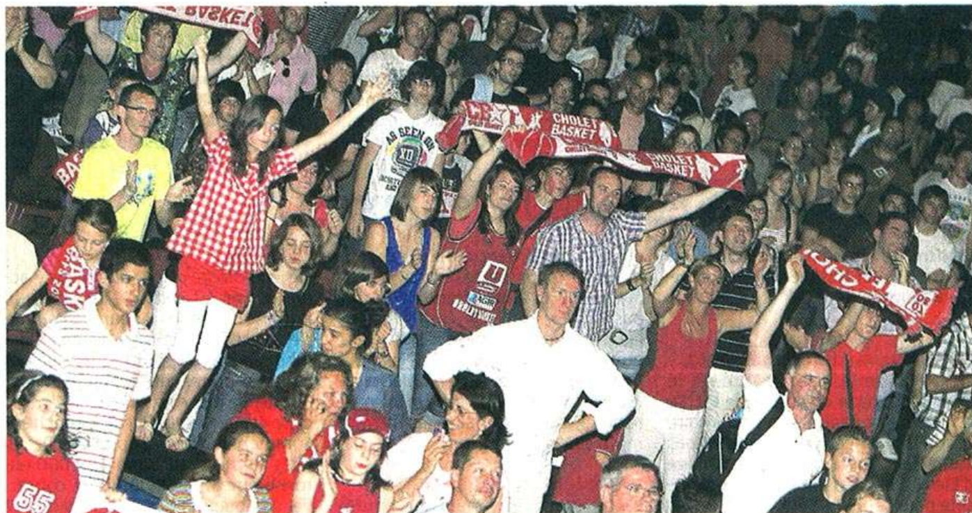
La Meilleraie a chaviré hier comme jamais. Les joueurs à Bercy l'ont forcément entendue.

« Je n'y crois pas, je n'arrive pas à y croire... » Jean-Paul, la soixantaine bien tassée, se passe la main dans les cheveux. Il fait partie des 3 000 Choletais venus à la Meilleraie en cette fin d'après-midi de dimanche. Jean-Paul est comme hypnotisé par l'un des trois grands écrans installés aux angles de la salle. Là-bas, à Bercy, les joueurs de Cholet-Basket négocient leurs derniers ballons le sourire aux lèvres, la joie pas même contenue. Des gradins de la Meilleraie monte la ritournelle espérée par toute une région : « on est les champions ». C'est trop de bonheur pour Jean-Paul qui s'assoit et cache son visage dans ses mains. Michel, son pote, détourne pudiquement le regard et lui passe la main dans le dos.