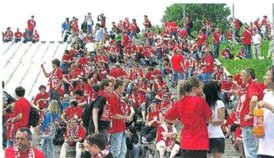
14 heures. Les supporters font de plus en plus de bruit sur la pelouse du Palais omnisports de Paris Bercy. Certains en profitent pour déjeuner, d'autres pour s'échauffer les cordes vocales.