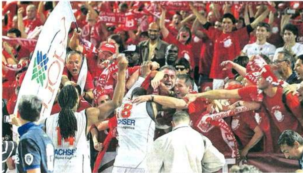
Paris-Bercy, hier soir. Le choudron parisien n'a pas fait peur aux Choletais venus en nombre à cette finale. Et la bataille a aussi été gagnée dans les tribunes.

3 500 Choletais se sont déplacés à Bercy. Ils sont revenus dans la nuit avec le titre de champions de France des supporters.