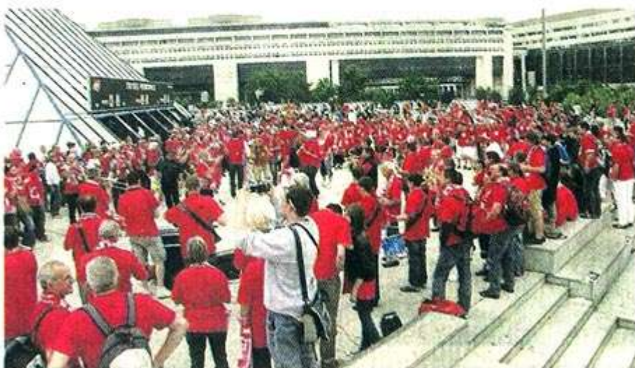
15 h 30. Aucun Manceau n'est encore arrivé (ou presque) au POPB. En attendant, ce sont les Choletais qui assurent l'ambiance musicale à l'entrée du chaudron, face au ministère de l'Économie.