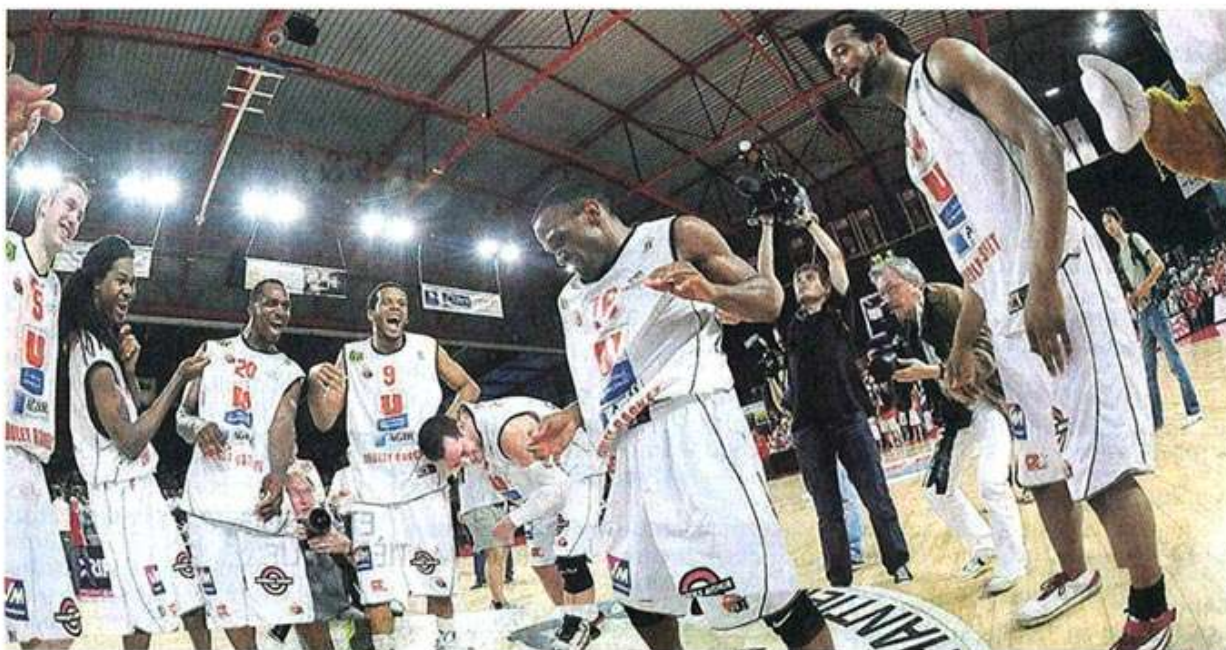
Les joueurs ne voulaient plus quitter le parquet de La Meilleraie. Les héros ont fait la fête pendant de longues minutes.