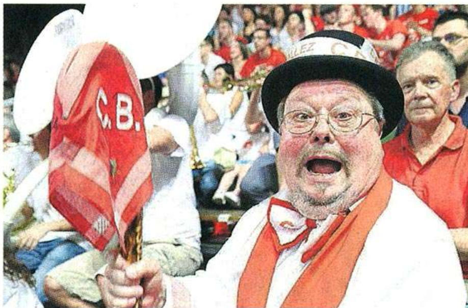
Rouge et blanc. Telles étaient les couleurs des tribunes de La Meilleraie hier soir. Le mouchoir de Cholet en prime.