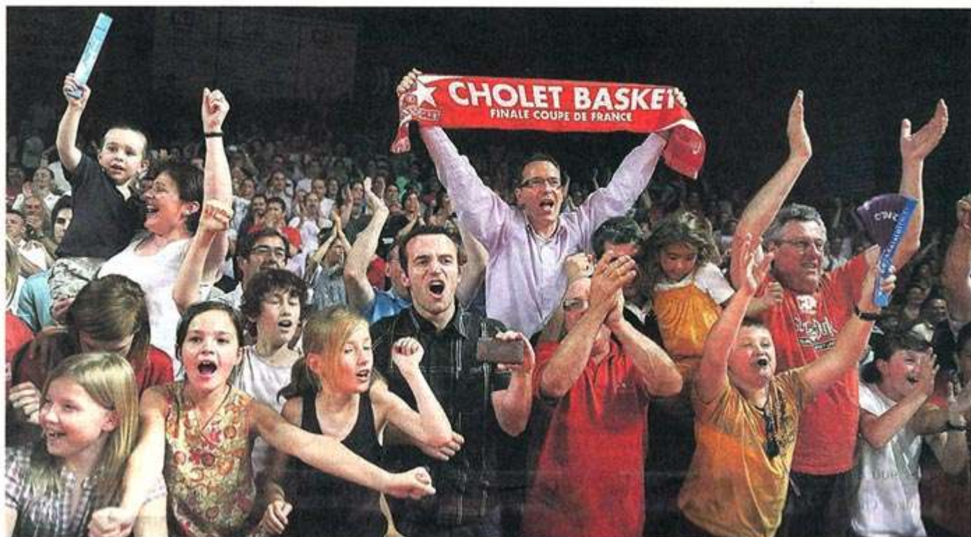
Cholet, La Meilleraie, hier soir. Dans un boucan d'enfer, le public choletais n'a cessé d'encourager son équipe victorieuse.

Les Choletais l'avaient rêvé, les joueurs l'ont réalisé.. Les joueurs ont effectué un, deux, trois, quatre tours de salle pour serrer les mains du public. Le rêve n'est pas fini, Paris attend Cholet, et... Bercy Messieurs pour ces minutes de bonheur.