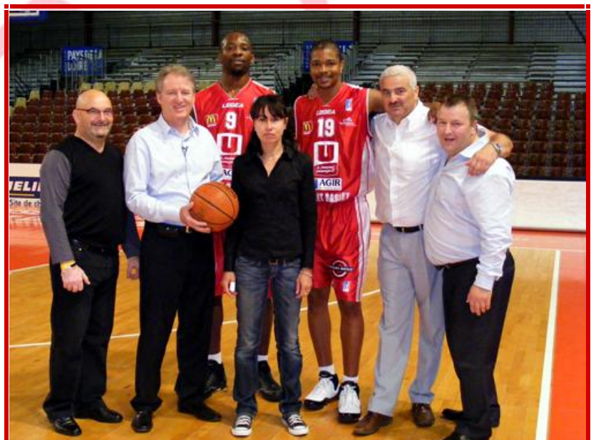
Vidéo des 20 ans de GSF AURIGA