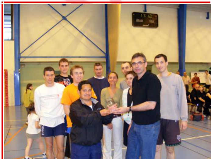
L'équipe Point P, vainqueur du Tournoi des Sponsors pour la seconde année consécutive.