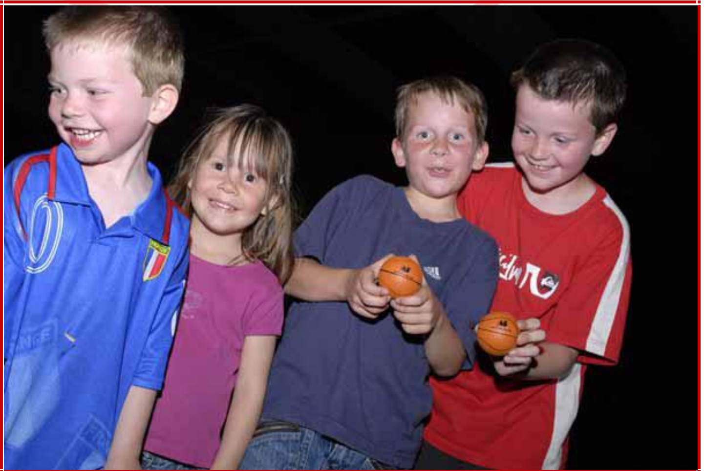
Distribution des balles A5