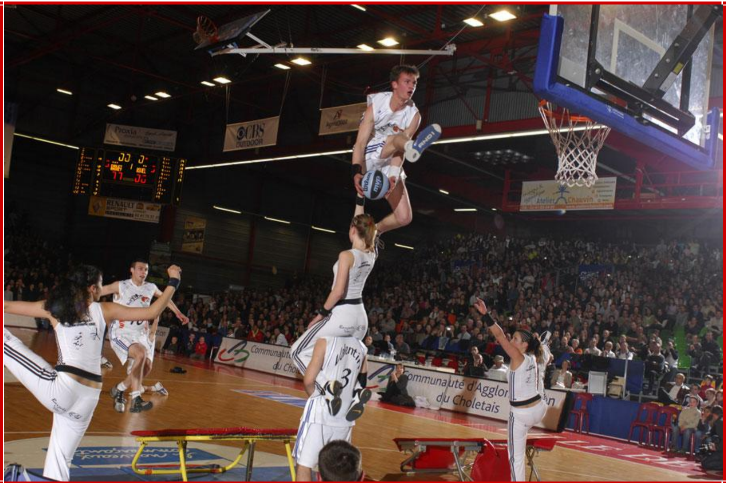
Show des Barjots Dunkers