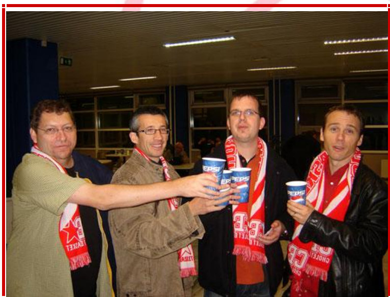
Malgré la défaite, les supporters lèvent leur verre à la bonne prestation choletaise.