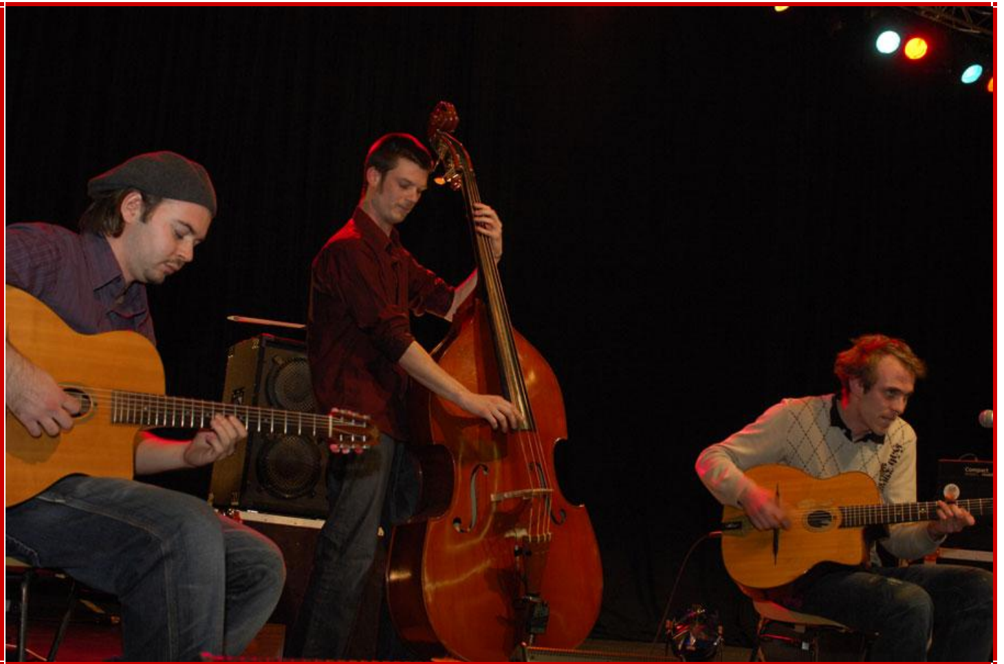
Représentation du groupe Pomp Fiction