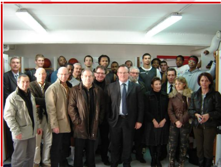
Rencontre avec les membres de l'association Dynamique Entreprises Cormier