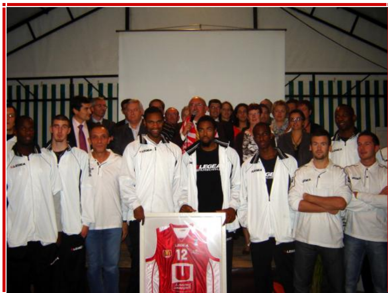
Inauguration des nouveaux locaux de la SOREGOR

Les joueurs de l'équipe pro ont participé à plusieurs animations commerciales ou de relations publiques (portes ouvertes, inauguration, séminaires...) organisées par nos partenaires dans leurs locaux ou lors de rencontres à l'extérieur.