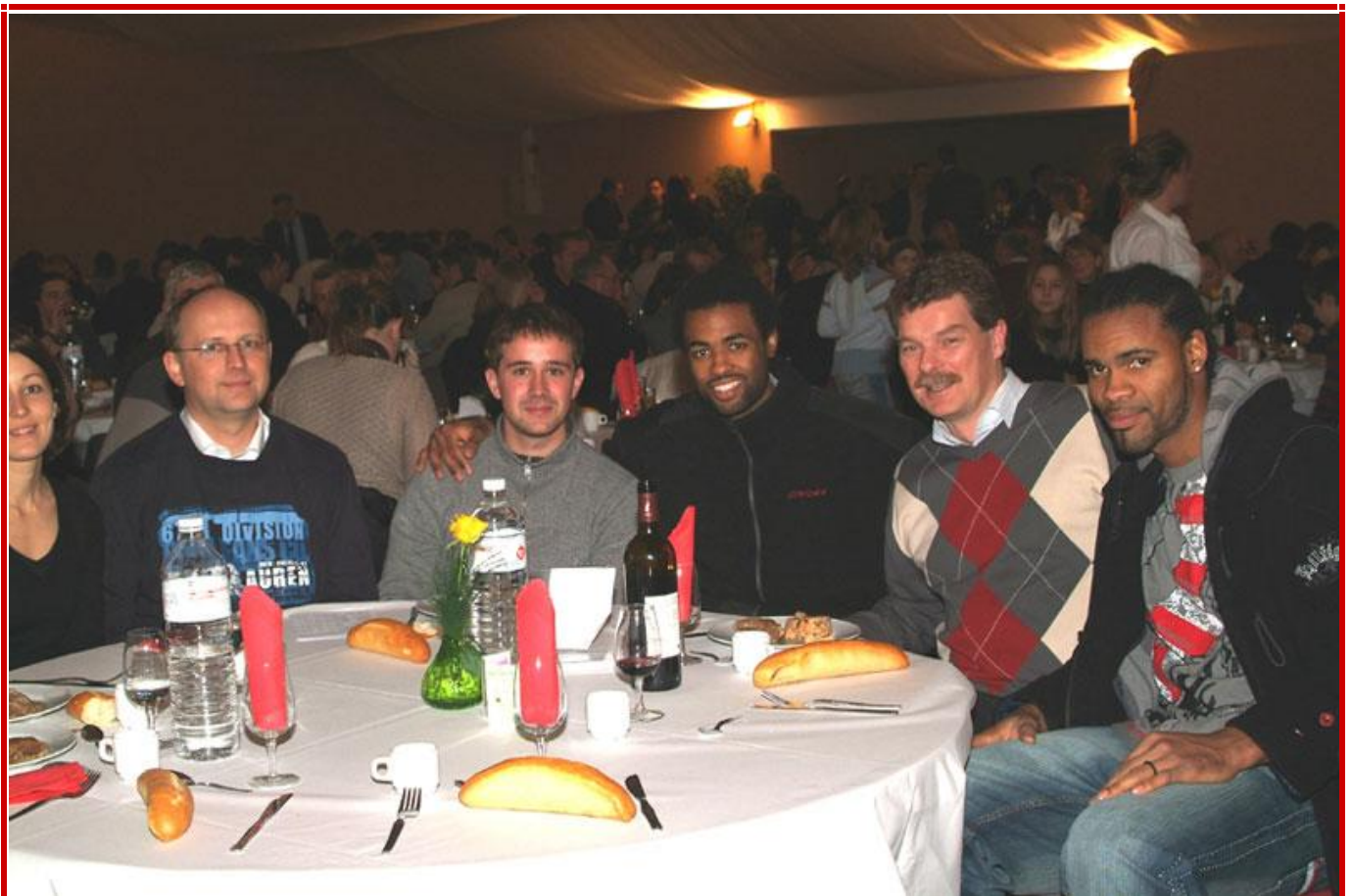
Rencontre avec les joueurs