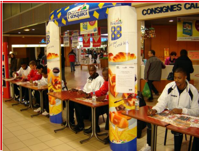
Animation commerciale BRIOCHE PASQUIER