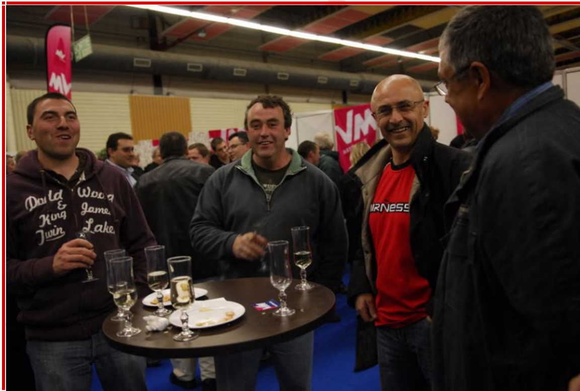
Cocktail d'avant match