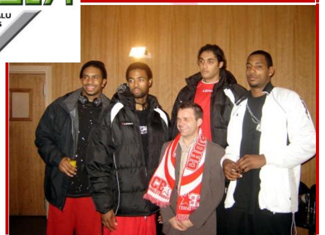
Soirées BATISTYL lors de certaines rencontres à l'extérieur.