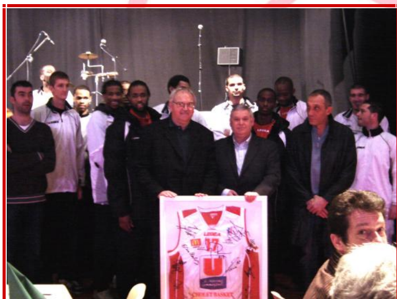
Salon SOFITEC organisé par la SOFIP