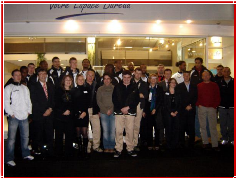
Portes ouvertes CBS

Concessionnaire Steelcase-Strafor Angers - Cholet