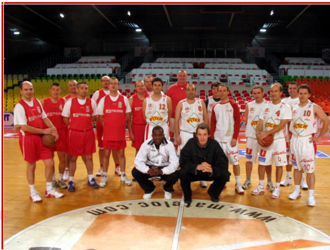
Photo avant la rencontre face à la Séguinière

Cette équipe est ouverte à tous les membres du CBE, que l'on soit pratiquant ou non, il est possible de se faire une place dans l'équipe.