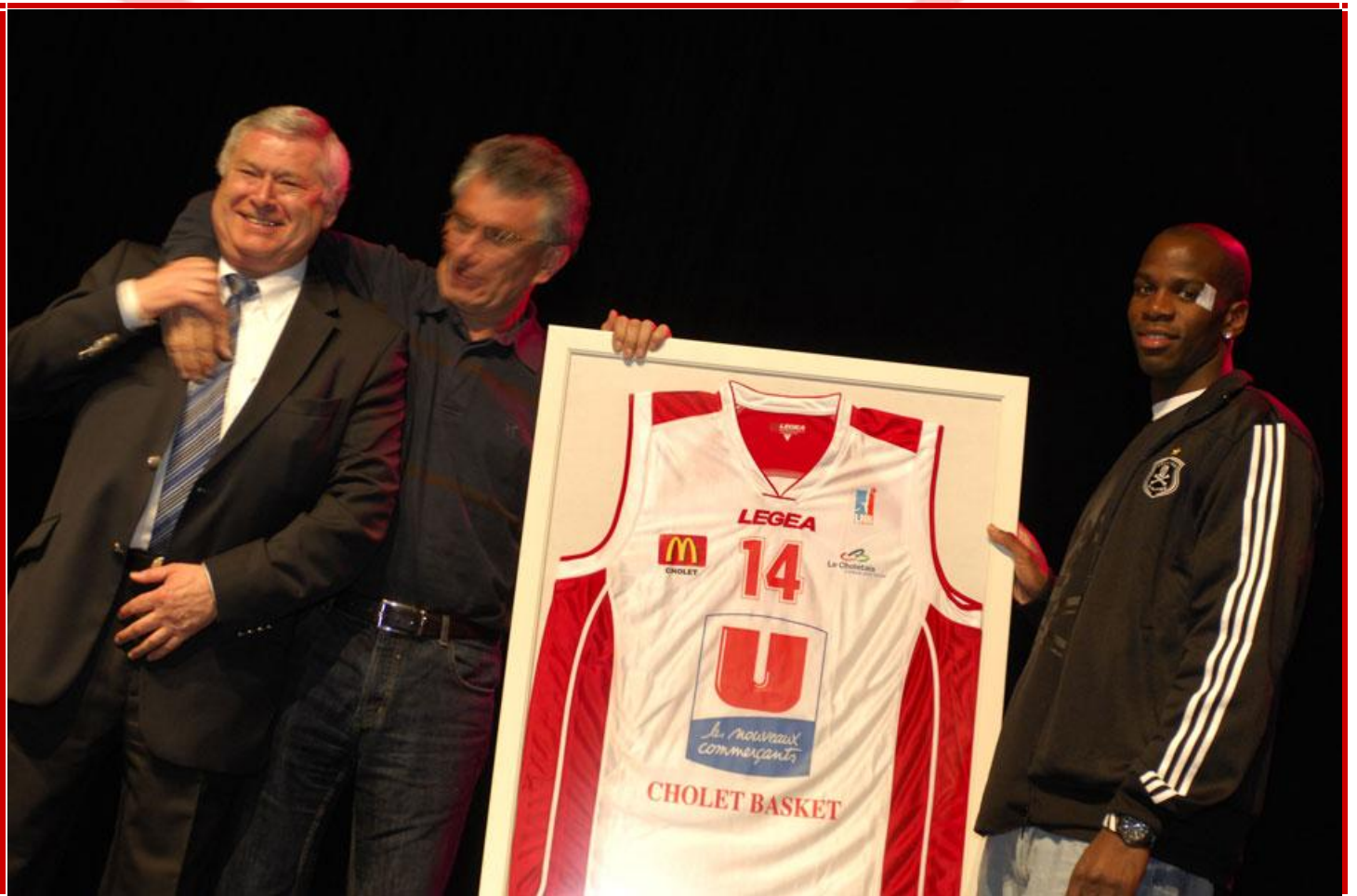
Remise de lots par les joueurs de l'équipe pro