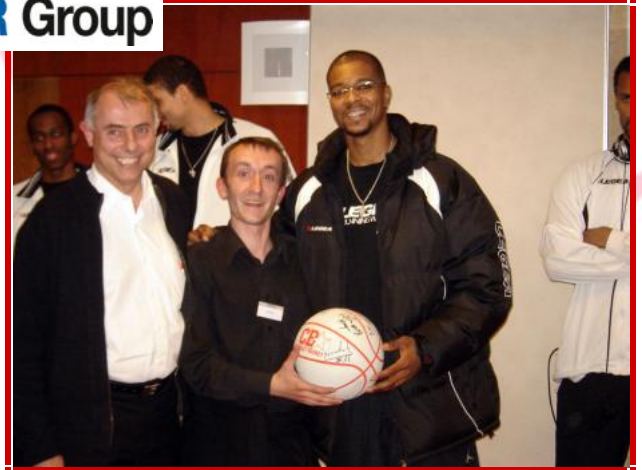
Soirées GRAVELEAU DASCHER GROUP lors de certaines rencontres à l'extérieur.