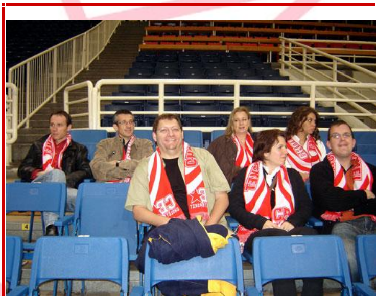
7 fidèles supporters dont 3 partenaires du club présents au match.