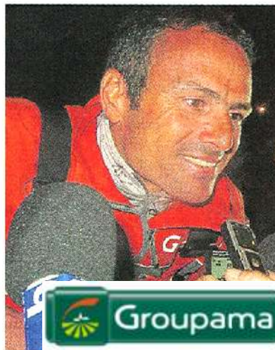
Franck Cammas, sollicité comme jamais à une arrivée de course.

En fait, on se contentait de cette 4 e place, même si on n'en était pas très fier... Et puis, ça s'est encore joué sur un empannage ( virement de bord par