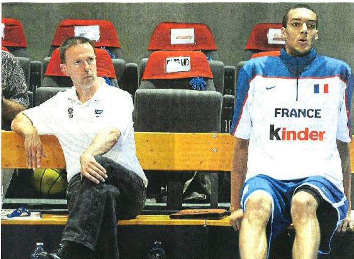
Boulazac, 28 juin. Les apparences sont parfois trompeuses. Rudy Gobert, ici aux côtés du sélectionneur national Vincent Collet, n'a pas fait une banquette en équipe de France. En trois matches avec les Bleus qui préparent les Jeux Olympiques, il a inscrit 8 points et gagné un gros gain d'heure de temps de jeu.

« Pas encore (entretien réalisé lundi). Je vais l'appeler pour faire le point avant de rejoindre l'équipe de France espoir et de commencer le championnat d'Europe, en Slovénie. »