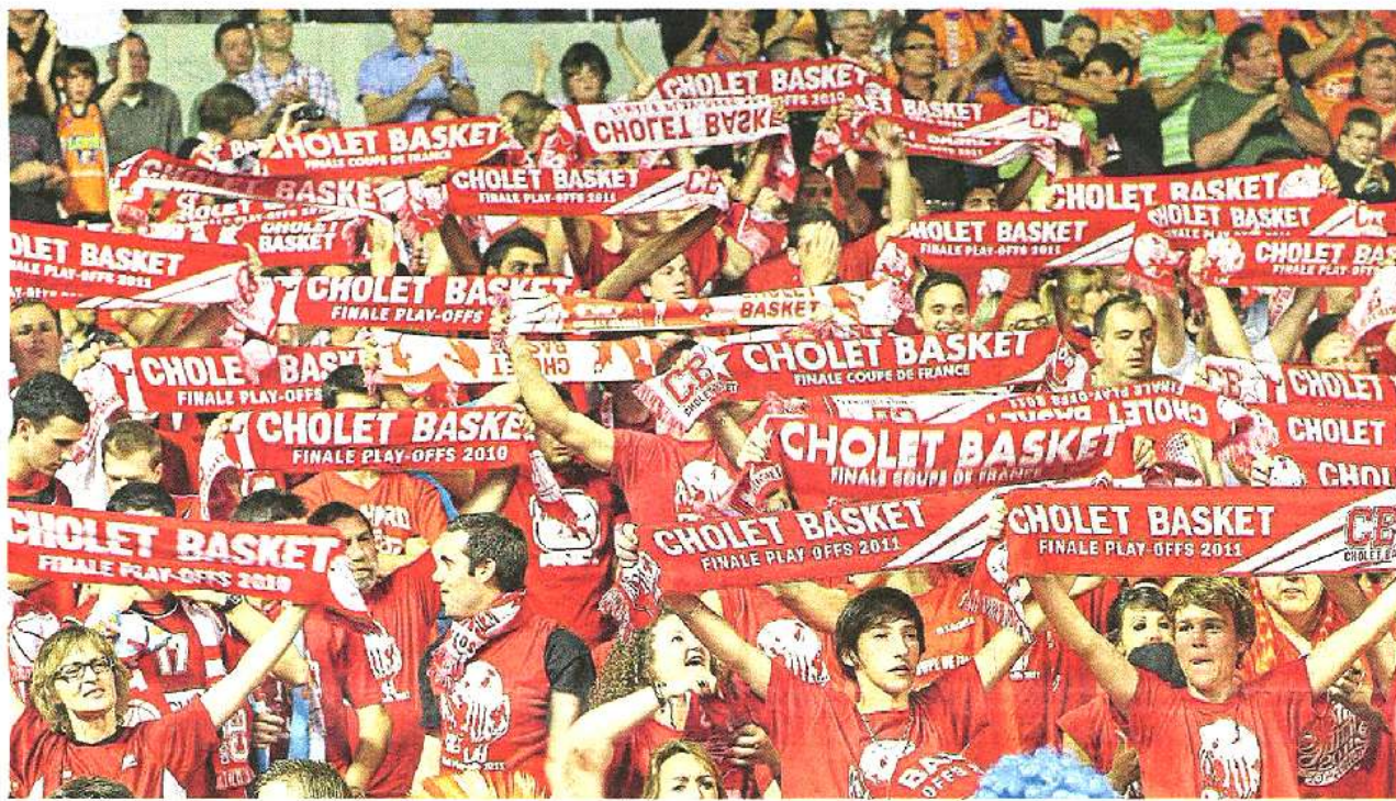
Le Mans, salle Antarès, samedi 9 juin 2012. Les supporters de Cholet Basket espèrent revivre des moments très intenses comme ce match d'appui en demi-finale des play-off face au Mans où ils s'étaient déplacés en très grand nombre.