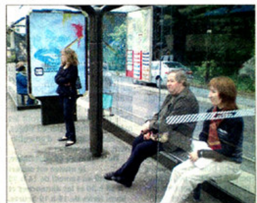
Place de l'Hôtel de ville, toutes les lignes du réseau Choiletbus se rejoignent