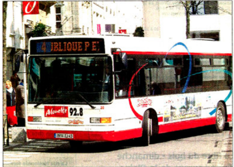
Les bus choiletains ont transporté 3 780 000 personnes en 2007