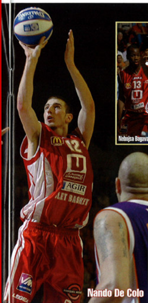
Nando De Colo