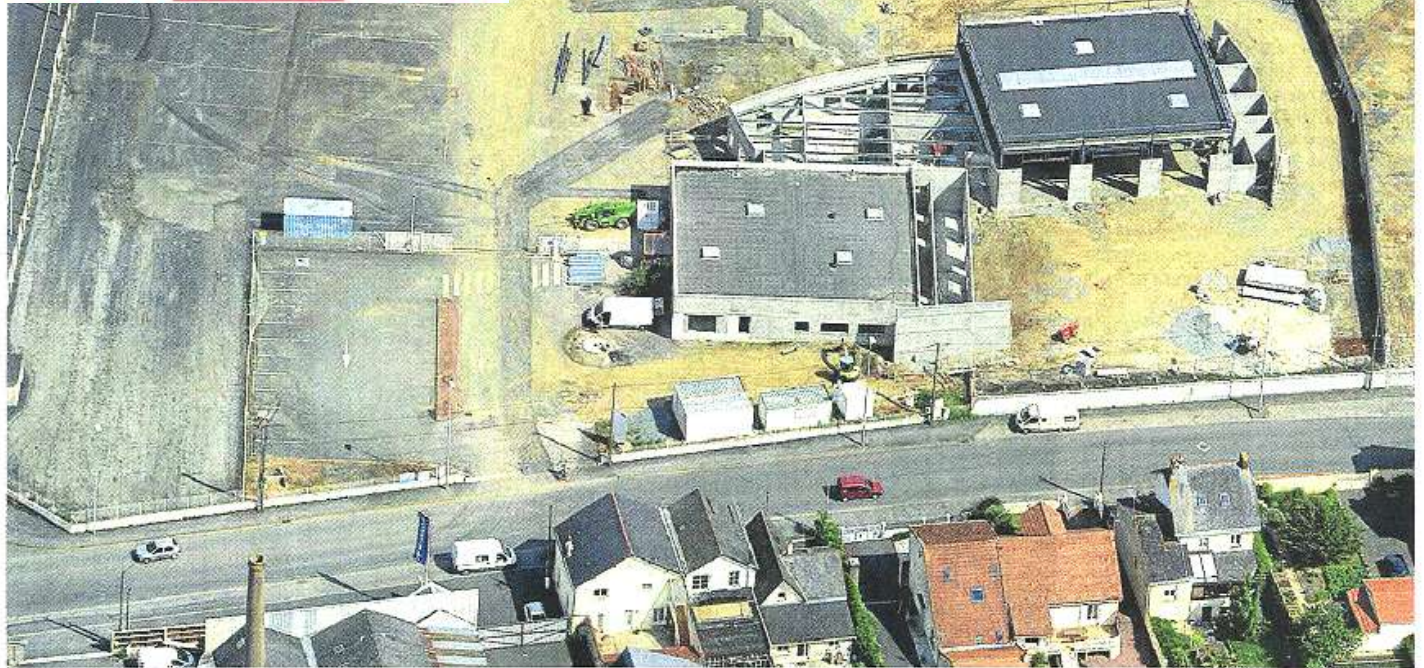
Cholet, hier. Le futur siège de Transports Publics du Choletais est en cours de construction rue de La Jominière.