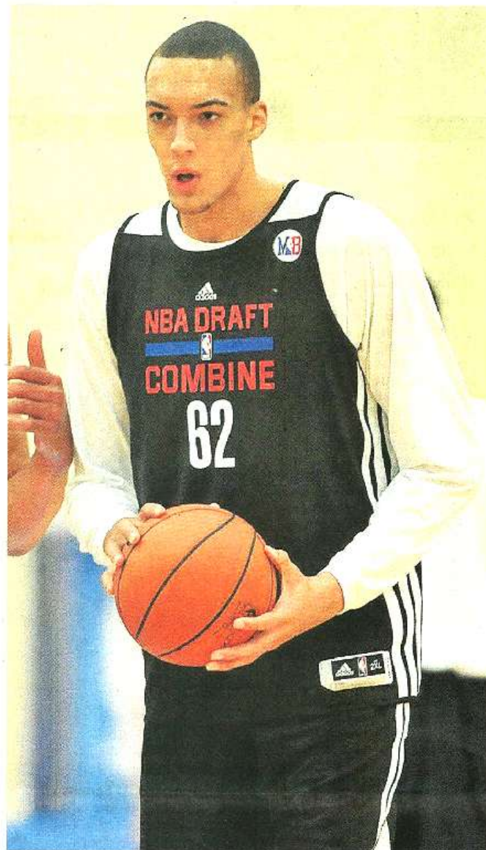
Chicago (Etats-Unis), le 17 mai. Après avoir visité une dizaine de franchises, Rudy Gobert s'appête à être drafté dans la grande ligue américaine.