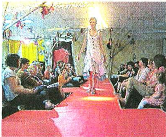
Le défilé de mode présenté jeudi soir au Greta.