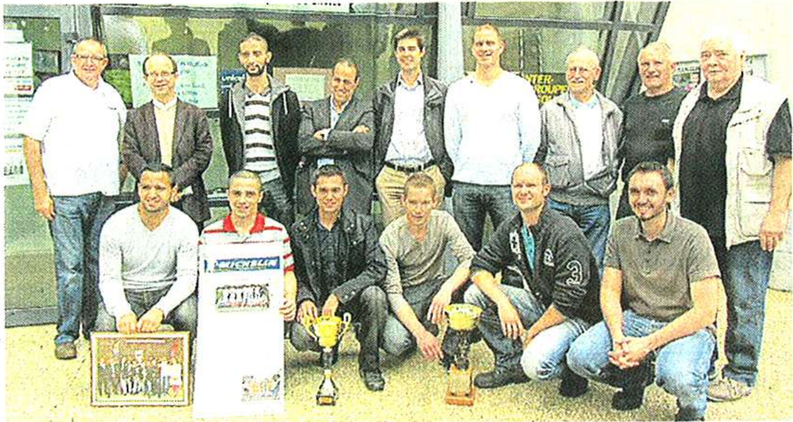
L'équipe Michelin avec les organisateurs de l'OMS.

Les joueurs de l'équipe Michelin, gagnants de la 39 e édition du tournoi de football inter-entreprises, se sont vus remettre la coupe du challenge Raymond-Russon lundi, dans les locaux de l'office municipal des sports. Ils ont battu le 24 mai dernier l'équipe finaliste de Thalès sur le score de 4 à 1.