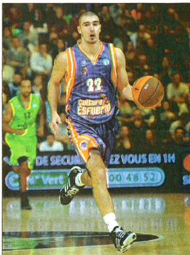
VILLEURBANNE, ASTROBALLE, 15 NOVEMBRE 2011. – Après trois belles saisons à Valence, Nando De Colo pourrait découvrir la NBA la saison prochaine à San Antonio, où il épaulerait son coéquipier en bleu Tony Parker.