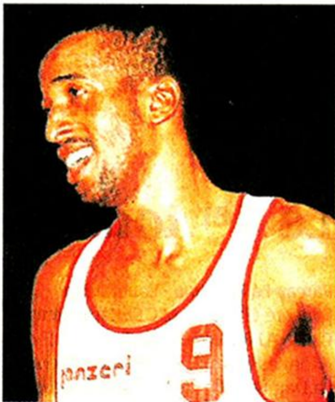
La légende Graylin Warner est de retour à Cholet !

CB-Hyères-Toulon. Les hommes d'Erman Kunter joueront leur deuxième match amical, demain, à 18 h 30, à la Meilleraie, contre Hyères-Toulon. A noter que Rodrigue Mels - jugé trop faible physiquement - n'a pas été conservé dans l'effectif.