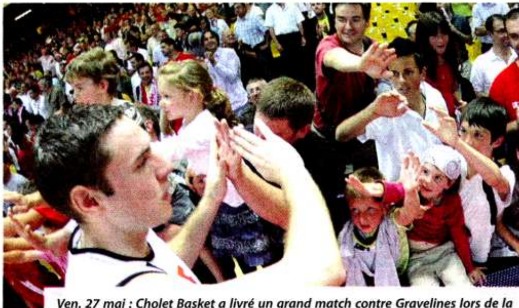
Ven. 27 mai : Cholet Basket a livré un grand match contre Gravelines lors de la première manche de la demi-finale des play-off et a bien sûr ravi le public. Match retour ce mardi en direct sur Sport +.