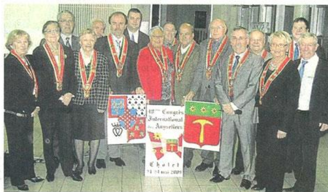
Tout est prêt pour recevoir les Anysetiers du monde entier.

Enfin, pour clôture ce congrès international qui se déroulera à la Meillerie du 21 au 24 mai, une dernière