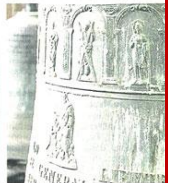
Entre l'activité cloches et clochers, et la conception d'afficheurs numériques, l'entreprise Bodet déploie un savoir faire plus que centenaire en accommodant des techniques ancestrales avec les moyens les plus sophistiqués.