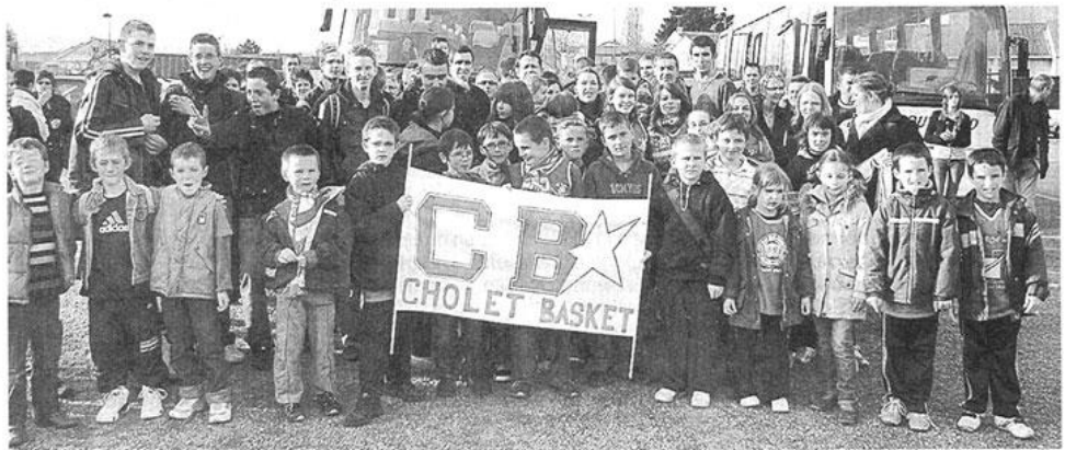
Banderoles et maquillages sont de mise avant le départ.

Ils étaient 120, portant écharpes ou maillots rouges, couleurs du club choletais, à se rassembler sur la place jouxtant la salle de sports pour monter dans les cars affrétés par l'USM basket. Ils étaient tous bien décidés à donner de la voix après la victoire remportée dernièrement par les Choletais évoluant sur le terrain de la Meillaie. « Il y a toute une ambiance qui entoure le match. Les gens, debout dans les tribunes, encouragent, soutiennent leur équipe favorite et la joie se fait entendre quand le score est en sa faveur. Et puis, les jeunes basketteurs germinois voient de près leurs idoles », rapporte un des dirigeants du club.