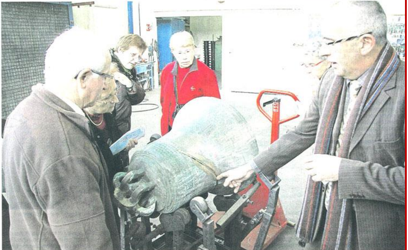
Trémentines, hier. L'activité de restauration des cloches représente, avec la construction des beffrois et l'installation d'horloge dans les églises, un tiers de l'activité.

Il y a 140 ans, Bodet montait les horloges dans les clochers des églises. 140 ans plus tard, l'entreprise basée à Trémentines a gardé ce savoir-faire et en a ajouté des tas d'autres à son catalogue.