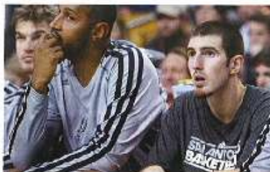
↑ Nando aux côtés de Boris Diaw sur le banc des Spurs qu'il a cédé plus qu'à son tour...

NDC : Les Spurs sont une franchise rodée, qui a de l'expérience et qui sait où elle veut aller. Les objectifs sont les mêmes chaque saison : aller en finale et gagner le titre. Donc c'est dur de comparer un club, quel qu'il soit,