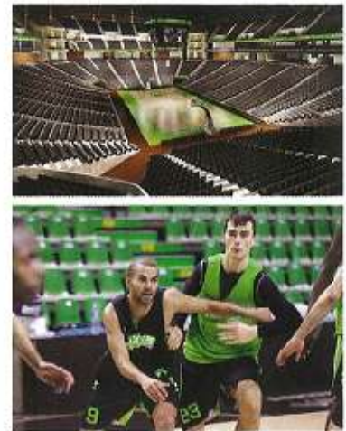
▲ Tony Parker avec le maillot de l’ASVEL dans une salle de 13 000 places ? Un rêve qui pourrait devenir réalité d’ici quelques années.