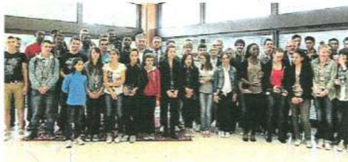
La remise des trophées scolaires 2013 s'est effectuée vendredi à l'hôtel de ville.

Collégiens et lycéens ont rapporté des médailles en athlétisme, football, escalade, basket, cross et en tennis de table.