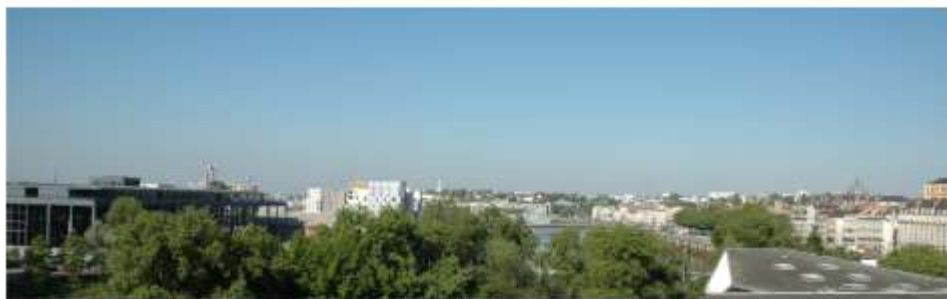
Vue panoramique depuis les bureaux