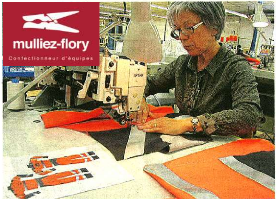
Mulliez-Flory dispose d'un atelier de prototypage au Longeron (Maine-et-Loire), sur les bords de la Sèvre nantaise.