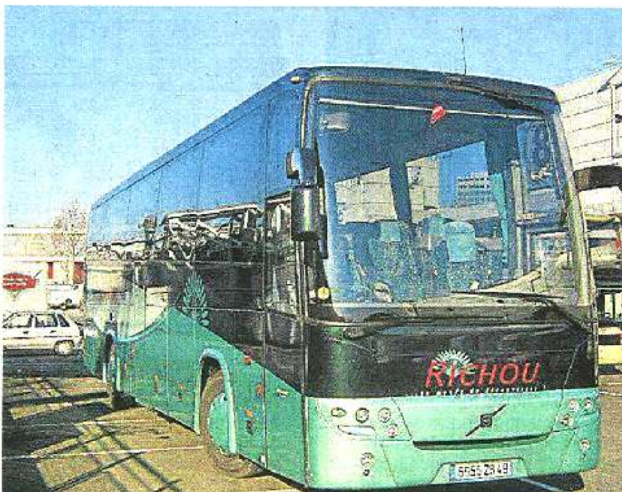
Chaque année, plus de 60 000 touristes voyagent avec le Groupe Richou, première entreprise de transport du département.