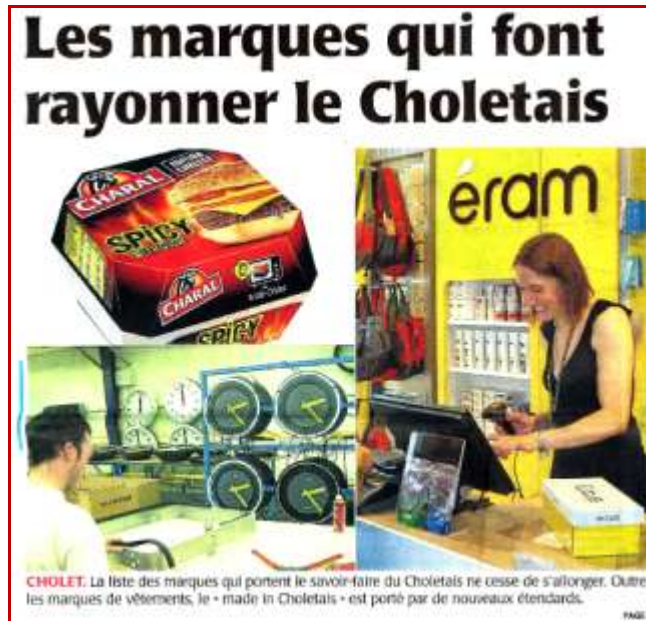
CHOLET. La liste des marques qui portent le savoir-faire du Choletais ne cesse de s'allonger. Outre les marques de vêtements, le « made in Choletais » est porté par de nouveaux étendards.

Le Courrier de l'Ouest – Jeudi 20 juin 2013