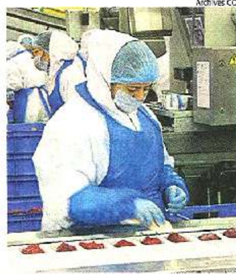
Un atelier de production Charal.

Bébé Confort : La marque d'articles de puériculture n'a pas vu le jour à Cholet. Elle a rejoint la société choletaise Morellet-Guérineau (landaus et jouets) en 1968 et a fusionné avec elle en 1976 pour devenir Ampafrance, une société rachetée en 2003 par l'actuel groupe canadien Dorel. Charal : La marque de viande bovine Charal a été créée en 1986 par le groupe Vital Sogéviandes, société parisienne d'abattage et de transformation de produits carnés. En 1997, la société Vital Sogéviandes est dé baptisée et prend le nom de Charal. Deux ans plus tard, le siège social de Charal est établi à Cholet. Charal dépend aujourd'hui du groupe Bigard.