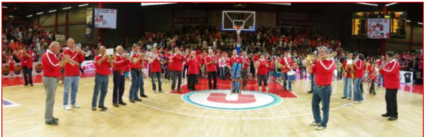
Fanfare de Bégrolles et St Christophe du Bois