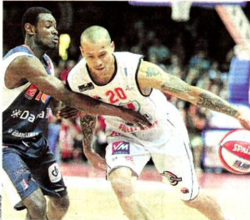
Cholet convaincu mais doit rester concentré pour la demi-finale retour à Gravelines. pages 8 et 9