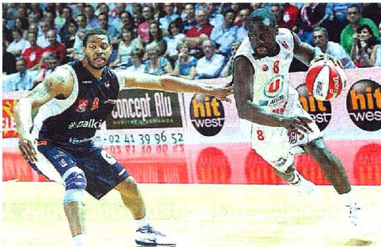
Cholet, la Meilleraie, vendredi soir. Houmounou, qui déborde ici Johnson, a marqué les premiers points de sa saison.