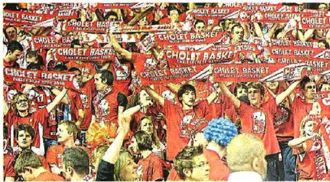
OMNIPRESENTS. Venus en force à Antarès, les supporters choletais ont su donner de la voix et de l'enthousiasme pour pousser derrière leurs joueurs. Hélas...