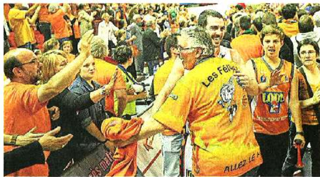
SOULAGEMENT. La joie des Manceaux et de leur public au buzzer final. Le MSB retourne à Bercy après avoir vaincu sa bête noire choletaise.

Le Courrier de l'Ouest – Dimanche 10 juin 2012