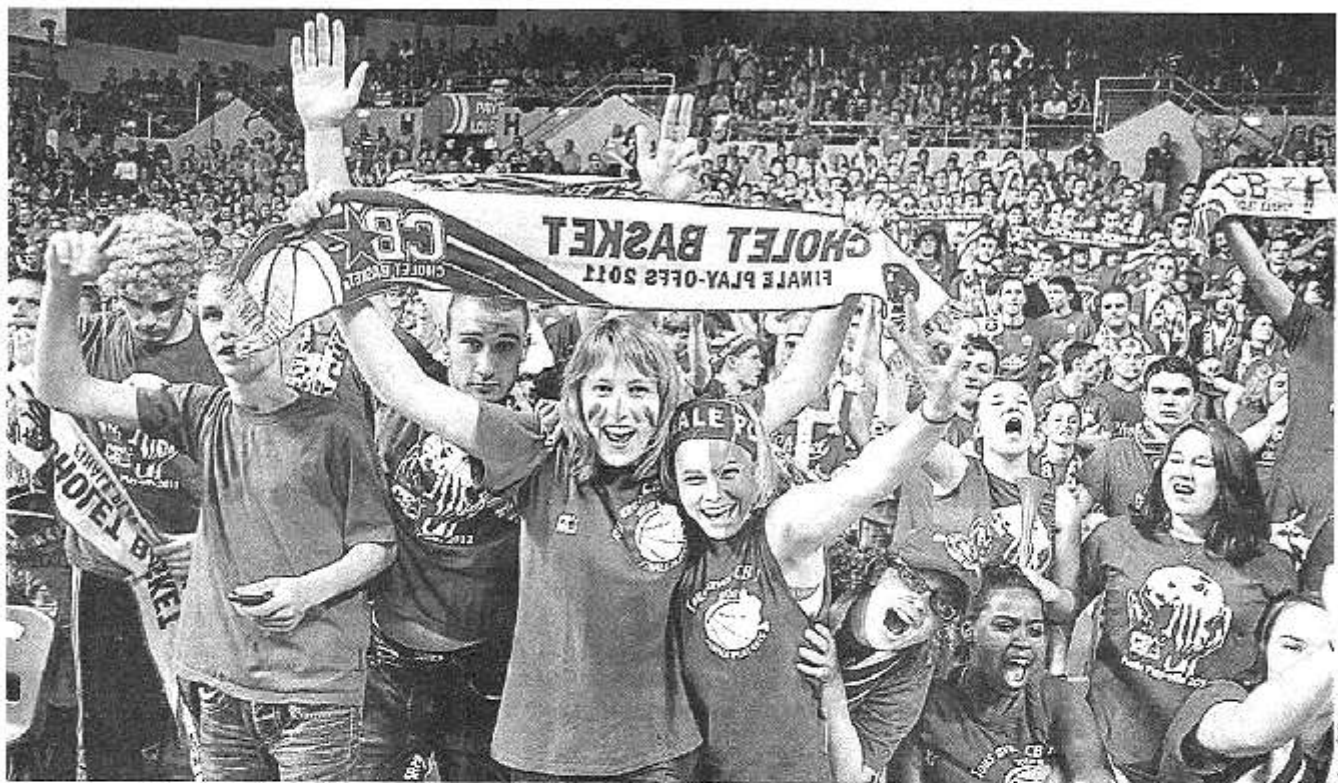
Samedi soir à Antarès. Jamais les supporters choletais n'avaient été aussi nombreux pour un match à l'extérieur.

Jamais les supporters de Cholet-basket n'avaient été aussi nombreux en déplacement que samedi soir, au Mans. Ils en reviennent forcément un peu déçus, mais fiers de la réaction de l'équipe.