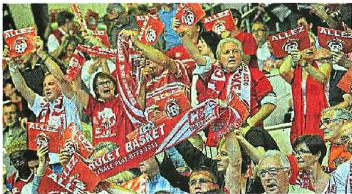
FERVEUR. La Meilleraye avait fait le plein hier soir pour cette demi-finale retour annoncée à guichets fermés depuis plusieurs jours. Au final, une folle ambiance !