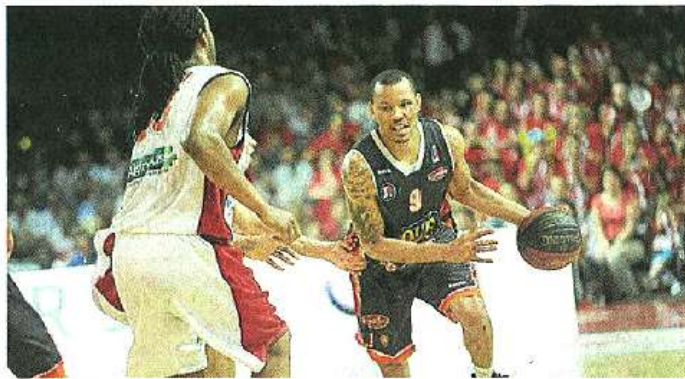
PRESSION. Acker et les Manceaux ont fait trembler le CB de Falck en lui infligeant un terrible 17-1 au retour des vestiaires. Cholet, pourtant, s'en est relevé.