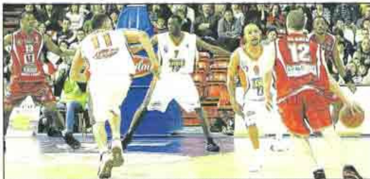
Le Mans, salle d'Antares, hier. La défense de zone du MSB a freiné CB dans le deuxième quart temps. Beaubois l'a fait écarter dans le troisième.

1 er QUART TEMPS : 23-28 L'entame parfaite existe-t-elle ? Si oui, elle ressemble sûrement à celle réussie par les Choletais. Impeccables en défense, les hommes d'Erman Kunter sautent à la gorge des Manceaux. De l'autre côté du parquet, De Colo et Beaubois enchaînent les tirs primés, et comme Braswell harcèle son vis-à-vis Dixon (3 interceptions) avant de distribuer presque autant de bons ballons (3 passes) qu'il ne tire. CB s'en vole (10-22, 6'30). Seules ombres au tableau, les deuxième fautes de Beaubois (6-47) et Falcker (6-57) ainsi que l'appartition de la défense de zone sarthoise. 2 e QUART TEMPS : 25-15 L'accès au panier sarthois se complique considérablement