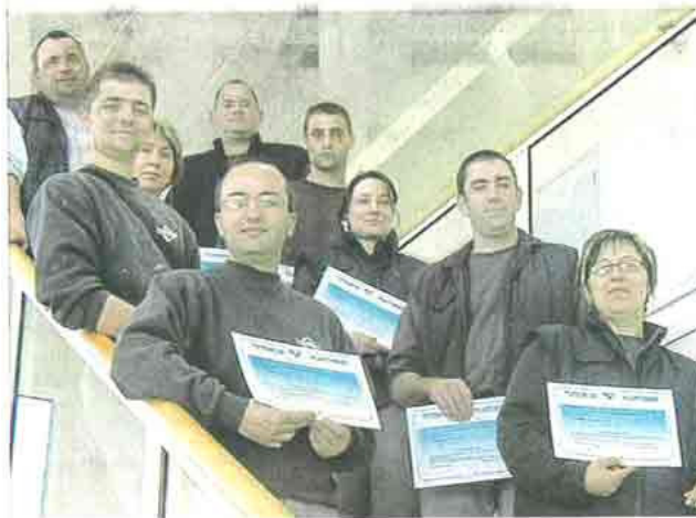
Les salariés diplômés de chez Batistyl prennent de la hauteur.

Batistyl à Maulévrier, a remis hier à 12 de ses salariés, un diplôme en tuteur plasturgie. L'entreprise emploie 300 personnes et recrute.