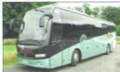
« Le groupe Richou, dont le siège social est basé à Cholet, dispose aujourd'hui de vingt agences de voyage réparties dans le grand Ouest. Ses deux sociétés de transports comptent 95 autocars, dont 42 de grand tourisme, et 25 minibus. »