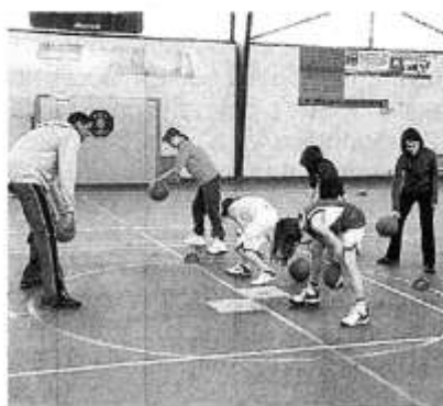
Au programme, séance de dribbles.

Autre événement important pour le club, les demi-finales des challenges