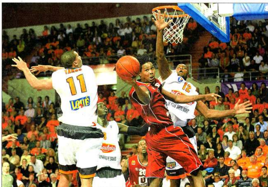
LE MANS, ANTARÈS, HIER. – Très important durant la prolongation, Mickaël Gelabale a réussi à arracher la victoire aux Manceaux Guillaume Yango et Thierry Rupert.