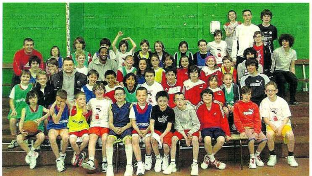
44 enfants du club ont participé au stage durant la première semaine des vacances de printemps.

Le club de basket de La Séguinière a organisé, la semaine dernière, un stage réservé aux jeunes licenciés du club. 44 enfants ont répondu présents. Le dernier jour, une belle surprise les attendait, puisqu'ils ont reçu la visite de deux joueurs de Cholet-Basket, qui ont même participé avec eux aux différents ateliers proposés. Le club organisera également un stage cet été : du 5 au 9 juillet pour les minimes et benjamin(e)s, du 12 au 16 juillet pour les poussin(e)s. En attendant, samedi prochain à Vihiers, dans le cadre du challenge de l'Anjou, les minimes ziniérais affronteront ceux du Saumur LB49 à 18 h 30 et les cadets, ceux de Sainte-Gemmes-sur-Loire à 20 h 30. Le même jour à 20 heures, l'équipe première disputera son premier match de barrage de Nationale 3 en recevant Pornic (match retour samedi 1 er mai). Enfin, en demi-finale de la coupe de l'Anjou, La Séguinière 2 et Le Puy-Saint-Bonnet 1 s'affronteront samedi 1 er mai à 21 heures à Saint-André-de-la-Marche.