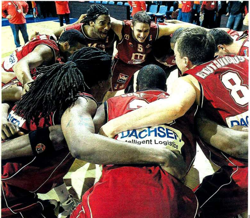
Les Choletais laissent exploser leur joie à la fin de la rencontre. Ils viennent de battre le leader et en profitent pour prendre les reines à trois journées du terme.

La différence se faisait quand même quelque peu sentir puisque Cholet, qui venait de passer un 12-6 au rebond aux Manceaux,