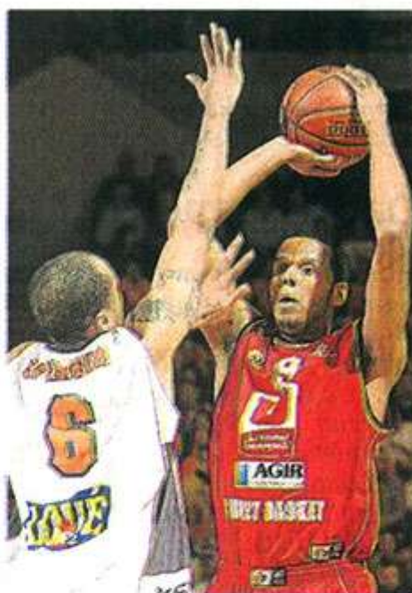
Meijia, meilleur marqueur du match avec 25 points, est élu meilleur joueur.