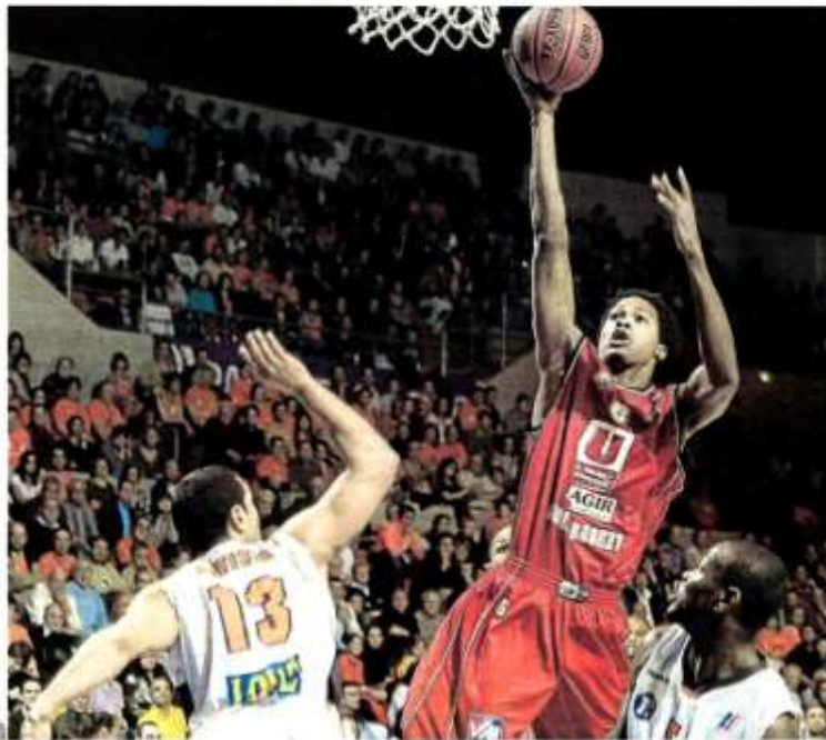
Vainqueur au Mans (83-85), Cholet rejoint son adversaire en tête de pro A. pages 8 et 9