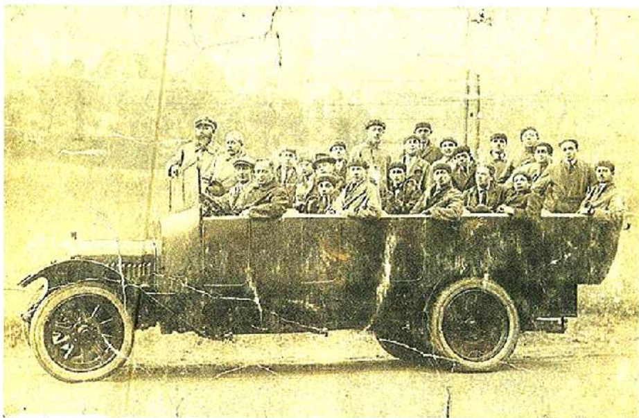
Avant-guerre, la Jeune-France en déplacement, dans un camion prêté par les industriels choletais...

Après la défaite de 1870, la gymnastique devient à la mode. Le patronage Notre-Dame-de-la-Garde l'intègre, avec la préparation militaire et la fanfare. Il en fera une de ses activités principales lorsqu'il donne naissance au patronage « Jeune-France » puis, en 1903, à l'association du même nom. Parmi les bonnes fées qui se penchent sur le berceau, les patrons textiles choletais, qui en seront longtemps les principaux contributeurs financiers.