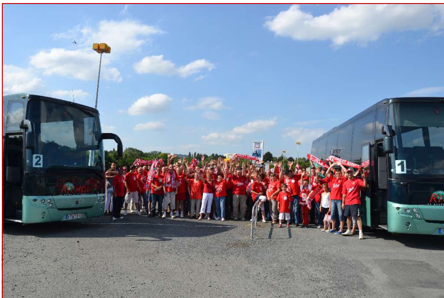
Les supporters de CB étaient nombreux à faire le déplacement au Mans.

Les statistiques de cette rencontre sont disponibles sur notre site www.cholet-basket.com