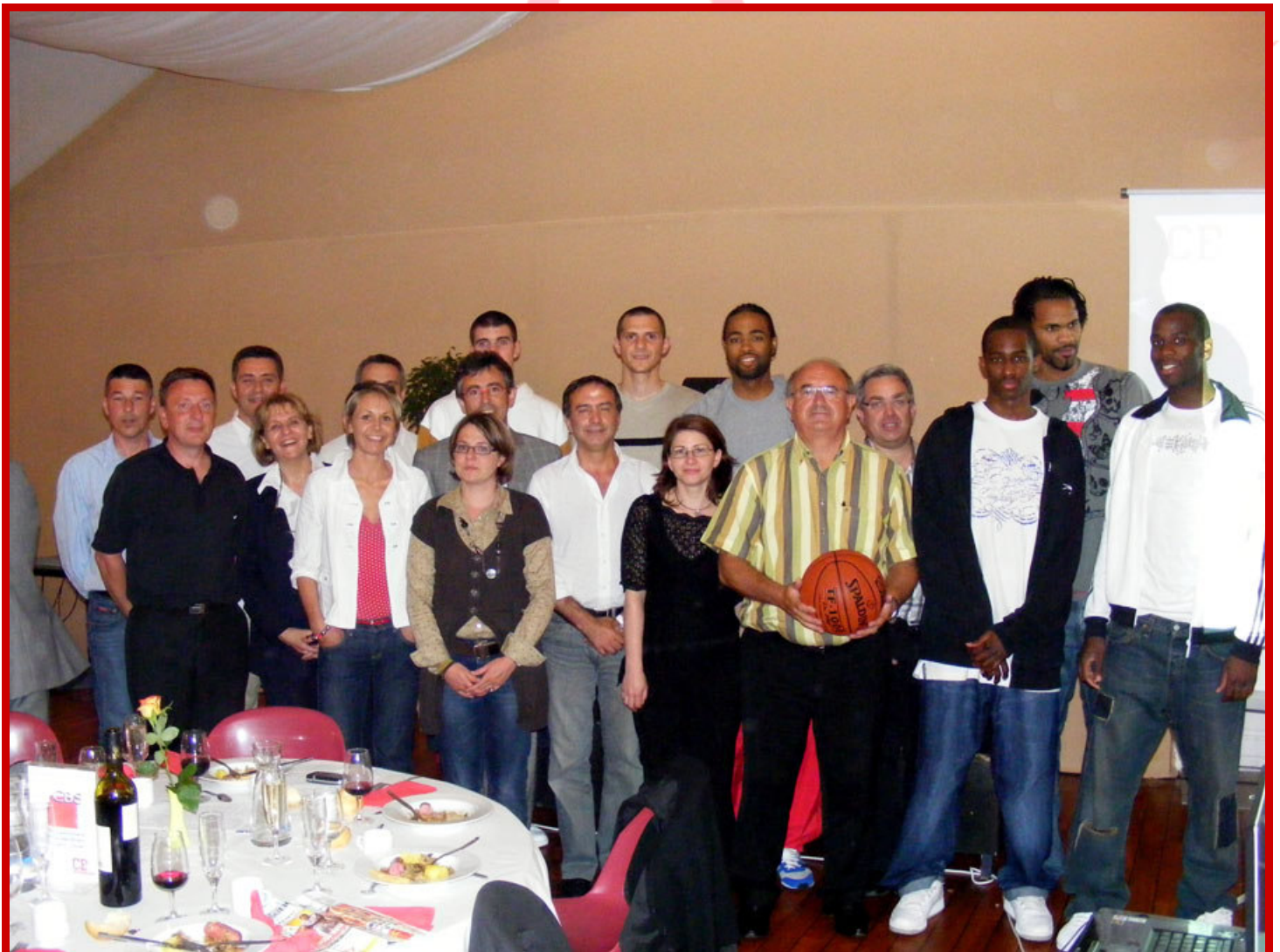
La photo de tous les gagnants du concours de pronostics.