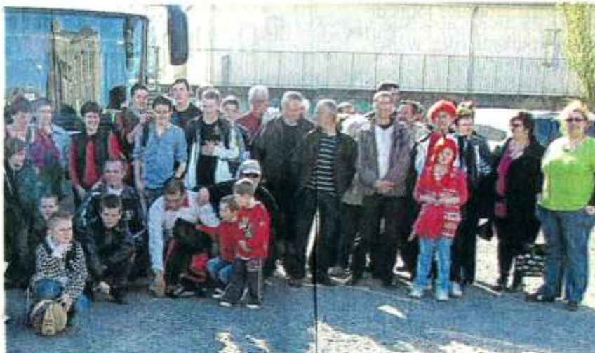
Avant le départ en car des supporters de Cholet-Basket.

Samedi, le club de basket germinois avait réuni 87 personnes pour aller voir évoluer une équipe professionnelle, Cholet-Basket, et en apprécier le jeu de haut niveau dans une salle de La Meilleray pleine à craquer.