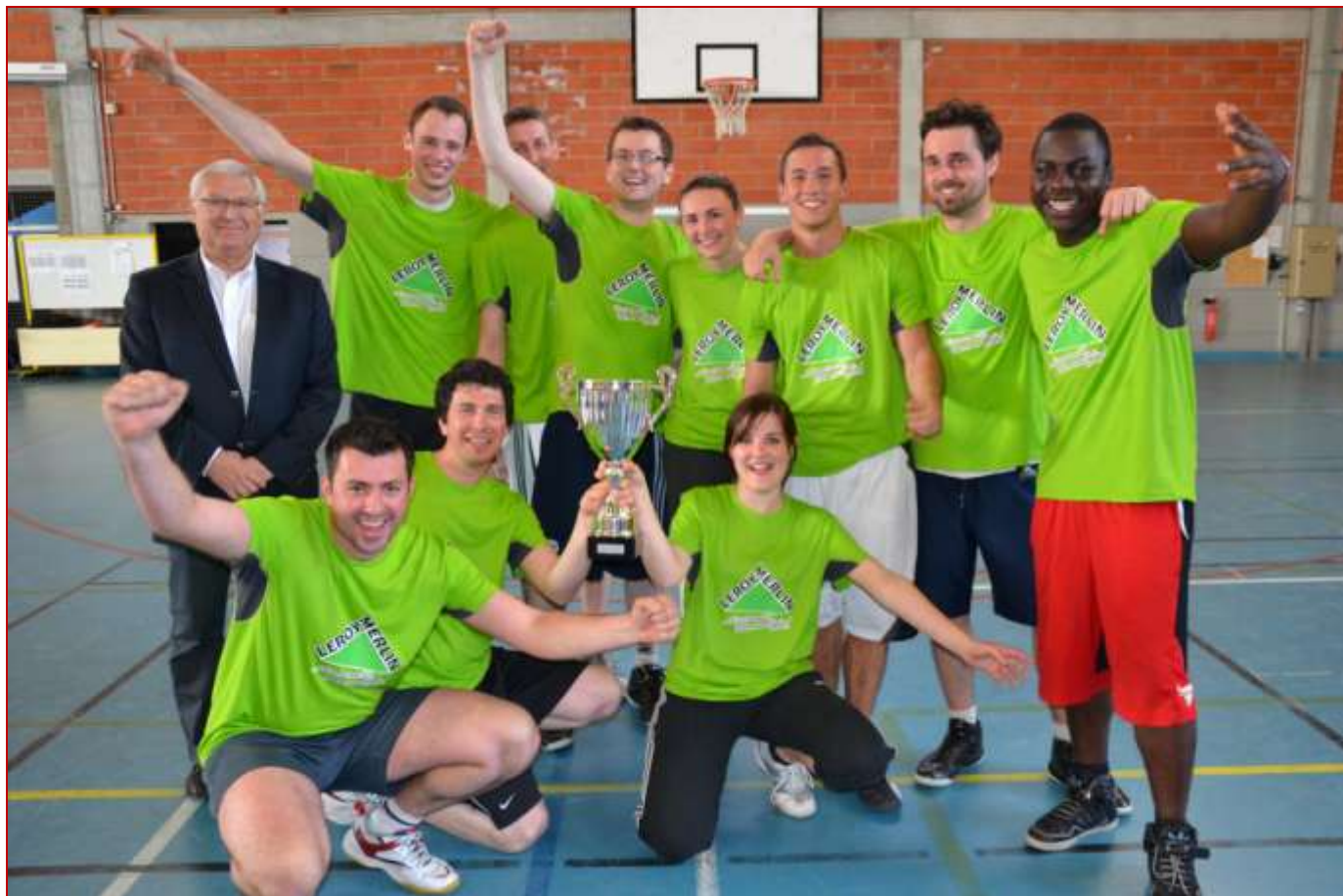
L'équipe Expobain vainqueur de la phase Euroleague