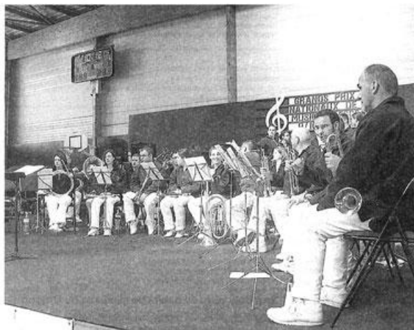
Les musiciens ont fait résonner leurs notes tout au long du week-end dans la commune.