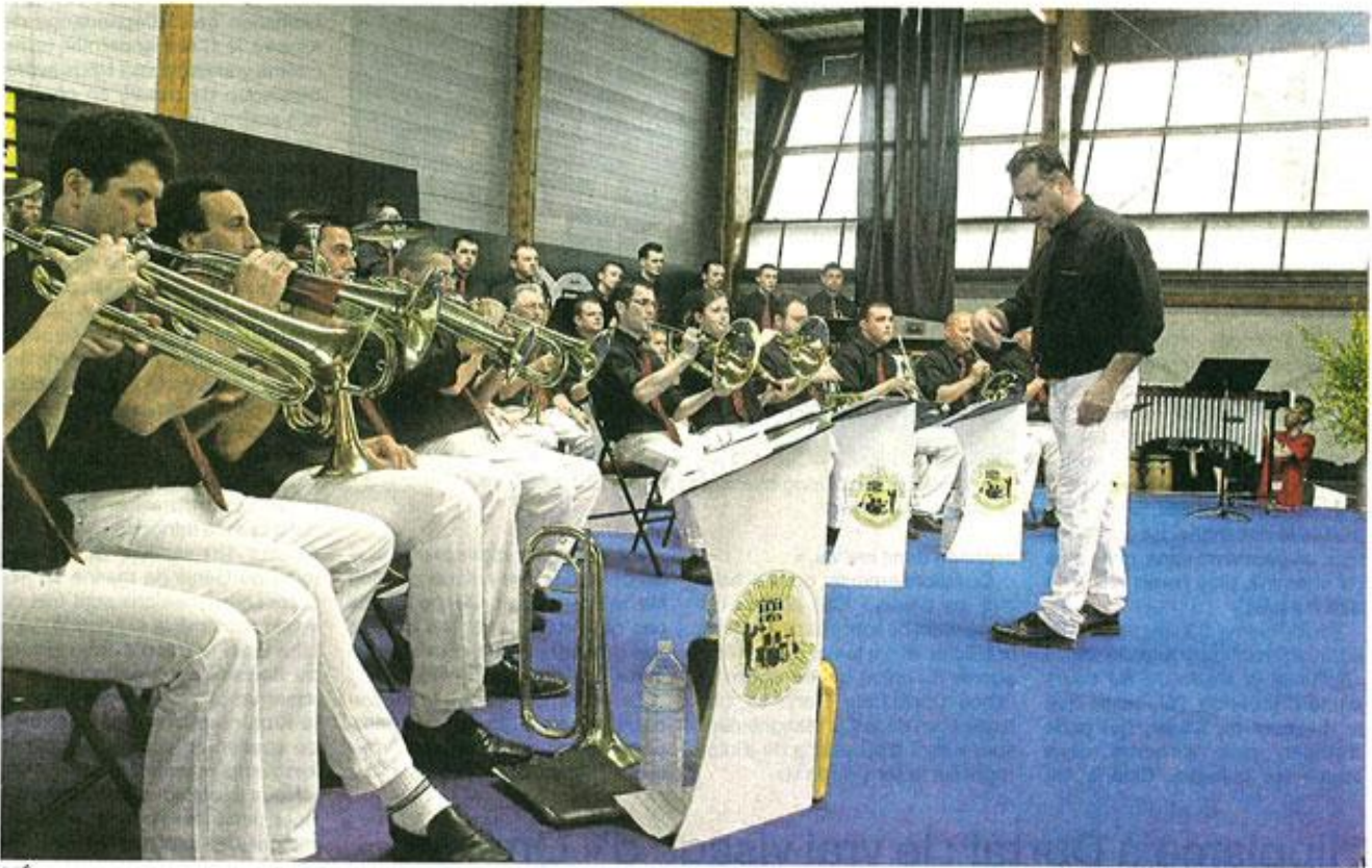
L'Énergie musique du May, lors de son audition, hier matin. La batterie-fanfare a remporté le titre de champion de France devant son public.

La batterie du May a décroché un titre déjà obtenu en 2001. Une performance établie devant son public et au terme d'une fête réussie.