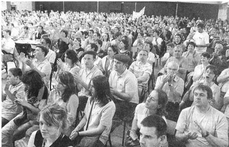
Les épreuves musicales du grand prix et le défilé qui précède le palmarès ont été suivis par un nombreux public.

« L'Energie musique championne de France ! Elle donnera un concert ce lundi à 13 h, au stade. Retrouvez les résultats du concours en page Cholet.