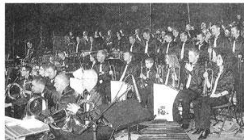
Le concert inaugural des grands prix nationaux, vendredi, a été d'une très grande qualité. Les nombreux auditeurs ont vivement apprécié ce prélude.