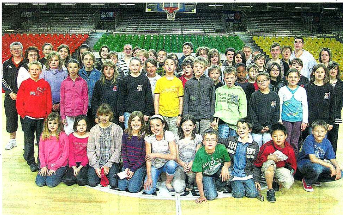
Sur le terrain de l'équipe de Cholet Basket, les jeunes du BCSV posent ici pour la photo.

La saison passée, deux joueurs de Cholet Basket ont encadré des ateliers lors d'un stage au sein du BCSV, le club de basket Coron-La Salle-de-Vihiers.