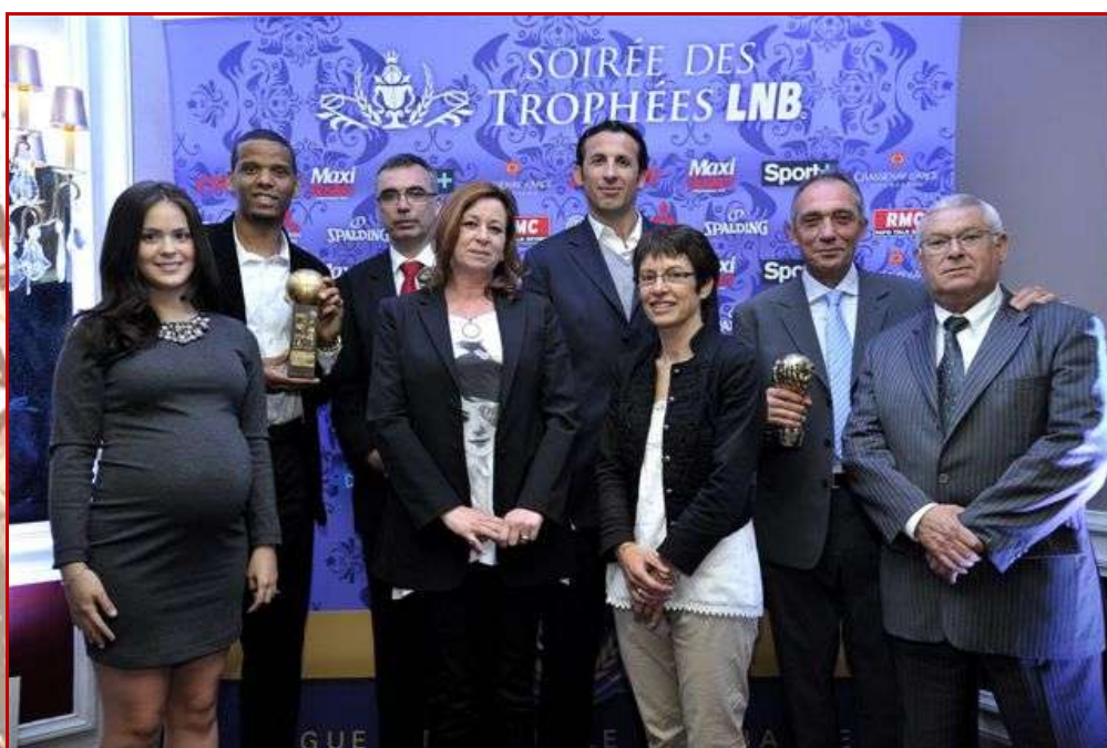
Les choletais posent avec leurs trophées.