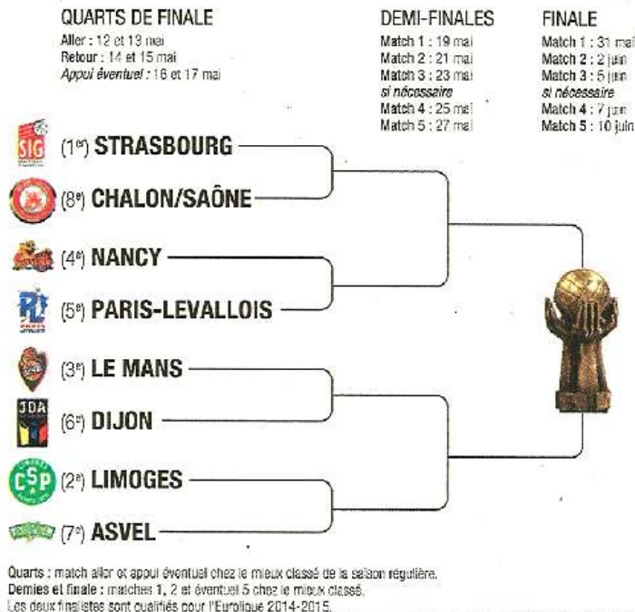
TABLEAU DES PLAY-OFFS 2013-2014

Le Courier de l'Ouest – Mercredi 7 mai 2014