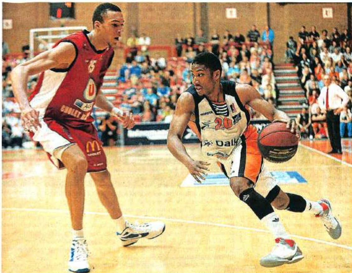
Rudy Gobert et les Choletais devront absolument l'emporter samedi à domicile.