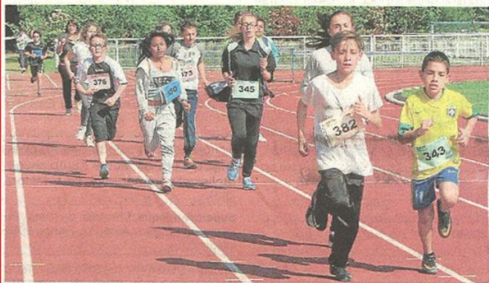
Les élèves de 5 e et 4 e du collège République ont participé à la course contre la faim, vendredi matin, organisée par le Cesc.

Un tour, vingt centimes. Ou un euro. Pour une élève, près de 20 € même ! Hier matin, au stade omnisports, pendant quarante-cinq minutes, les 220 enfants de 5 e et 4 e de la classe Ulys du collège République avaient une mission : courir un maximum pour récolter des dons. Ils seront reversés à Action contre la faim, en faveur de Madagascar.