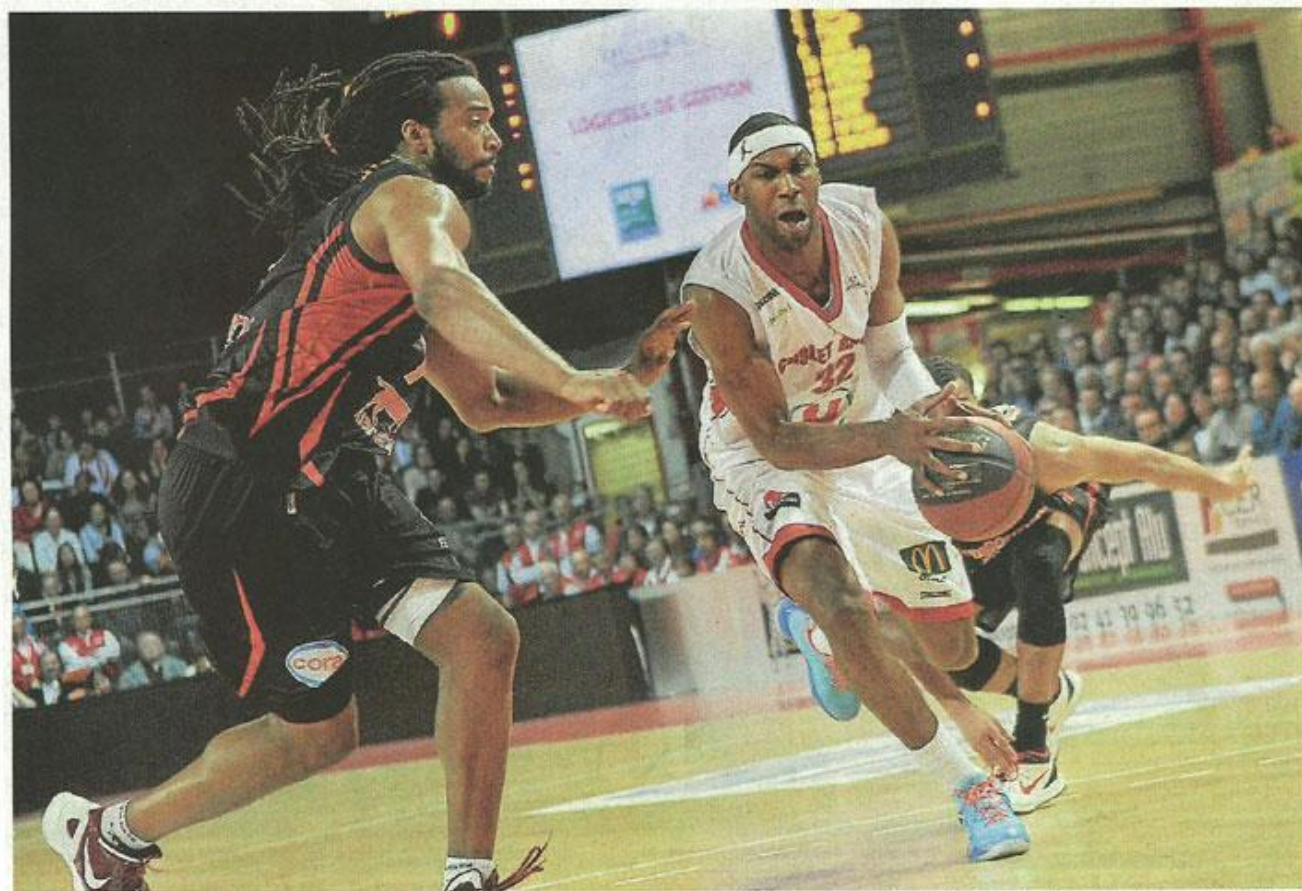
Cholet, la Meilleraie, hier soir. Malgré les 14 points et 11 rebonds de Falcker, les Choletais de Wilson se sont sortis du piège lorrain.