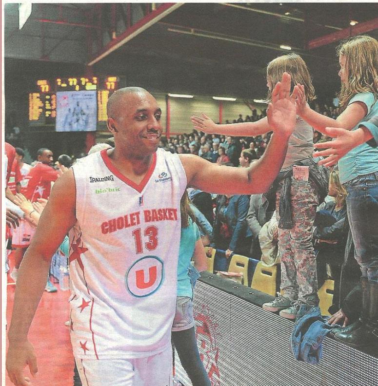
Cholet a mis un terme à sa saison à domicile en disposant de Nancy.