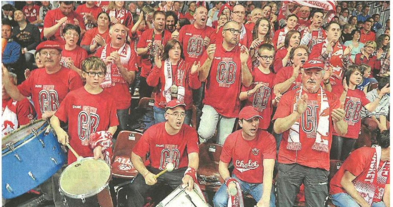
Cholet, 26 avril. Les C'Bulls, un groupe de supporters à fond derrière leur équipe.

Le groupe de supporters les C'Bulls et la fanfare animent les rencontres de Cholet Basket. Chez eux, malgré une saison sportive décevante, la passion du basket et de la musique n'a jamais fait défaut.