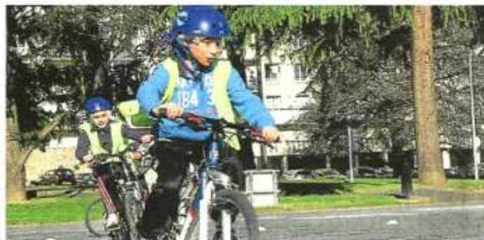
Cholet, salle des fêtes, hier. L'activité vélo avait pour but d'apprendre à circuler en utilisant les pistes cyclables et en respectant les règles de sécurité.

développement durable. Les questions environnementales et les enjeux de la mobilité durable (gaz à effet de serre, modes de déplacement doux...) sont abordés au cours de l'année. Les enfants ont ainsi travaillé sur les alternatives à la voiture individuelle, comme les déplacements en vélo, à pied ou encore le covoiturage.