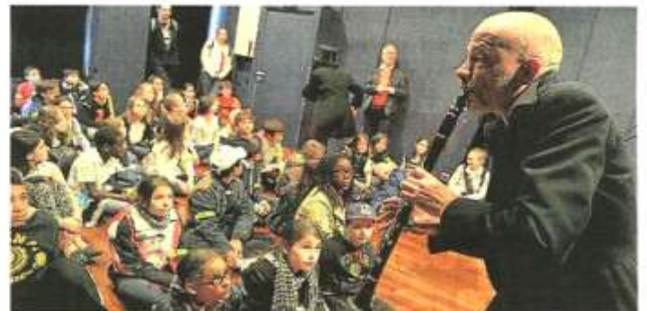
Cholet, Jardin de verre, hier. La matinée s'est achevée par un spectacle. Les trois musiciens ont alterné entre chanson française, rap et rythmes brésiliens.

Le Courrier de l'Ouest – Vendredi 18 avril 2014