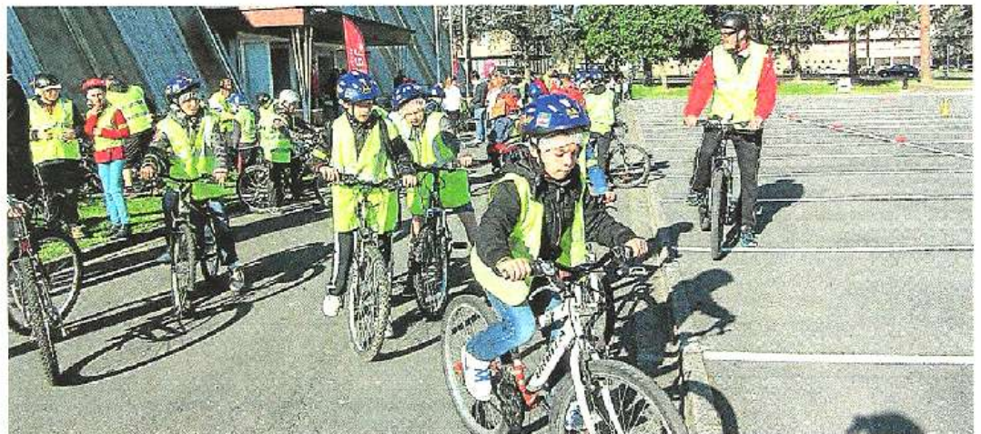
A vélo, en bus ou à pied, c'est parti pour découvrir comment se déplacer « durable » dans la ville !