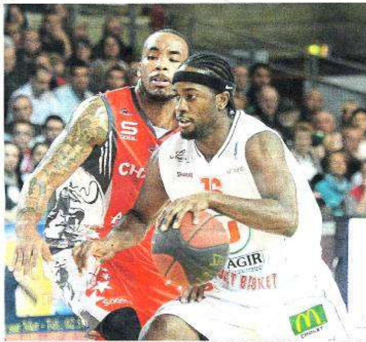
Vainqueur de Chalon, Cholet a pris une sérieuse option pour la qualification aux playoffs.