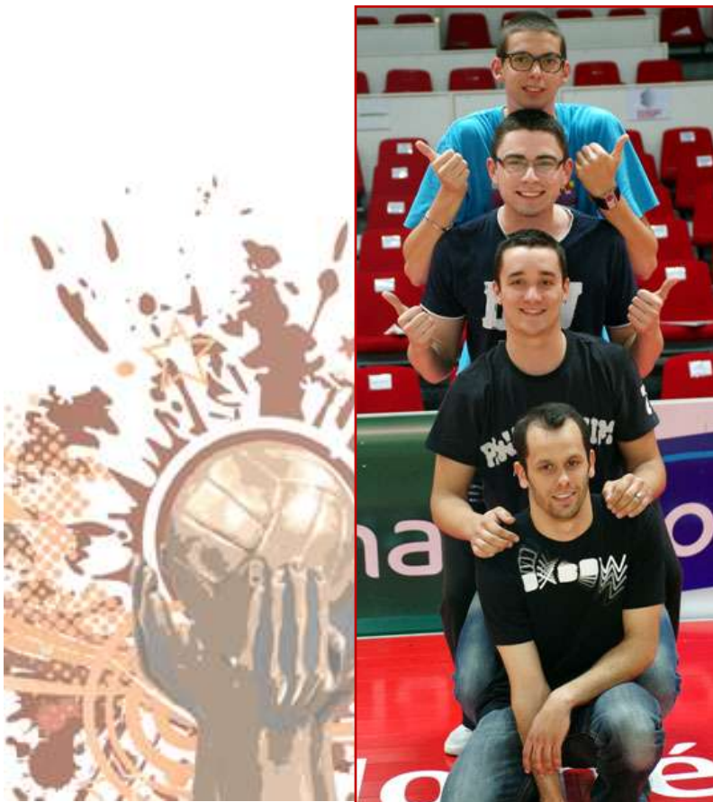
Les 4 vainqueurs du concours !