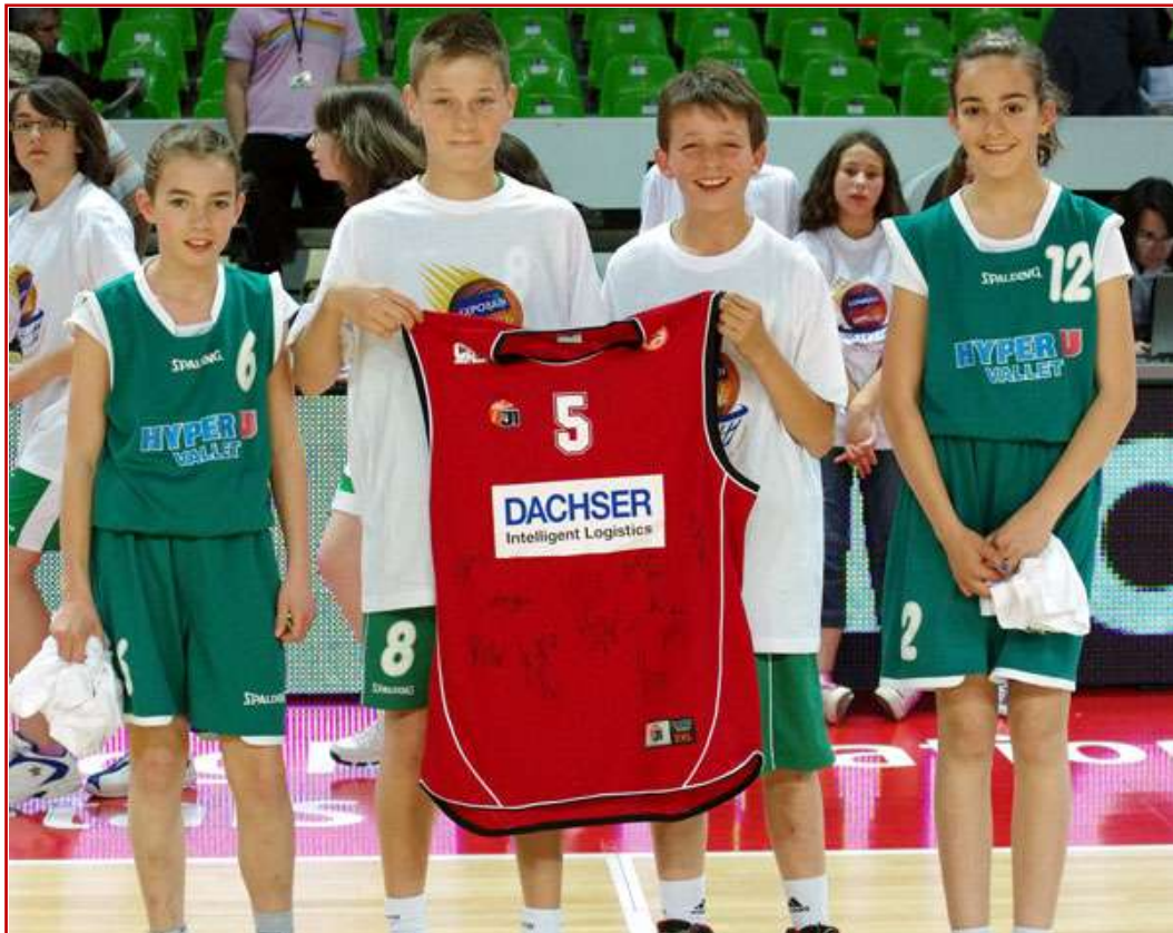
Et c'est LE GROUPE SAINT VINCENT LE PALLET qui en est sorti vainqueur