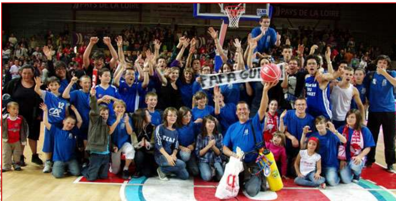
LES BLEUS BASKET DE SAINTE FOY ont été élus LE CLUB LE PLUS DYNAMIQUE