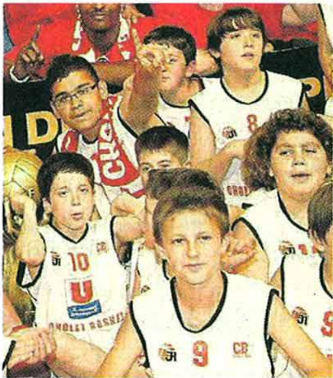
De la place à l'école de basket.