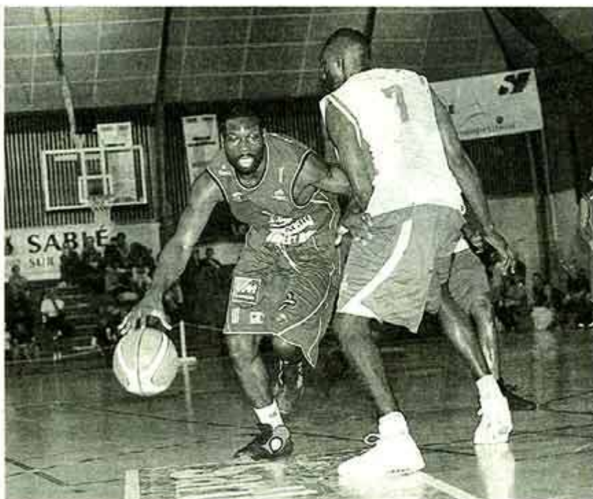
Cholet a dû s'incliner face aux Mans lors de la finale du trophée Sarthe - Pays de Loire.

Le Mans bat Cholet 62-60 (6-12, 11-8, 13-15, 23-18, 9-7)