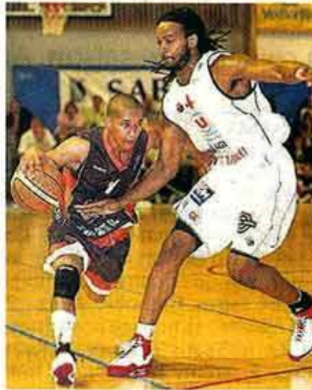
Sablé, hier soir. Pellin échappe à Falcker et c'est Le Mans qui gagne.