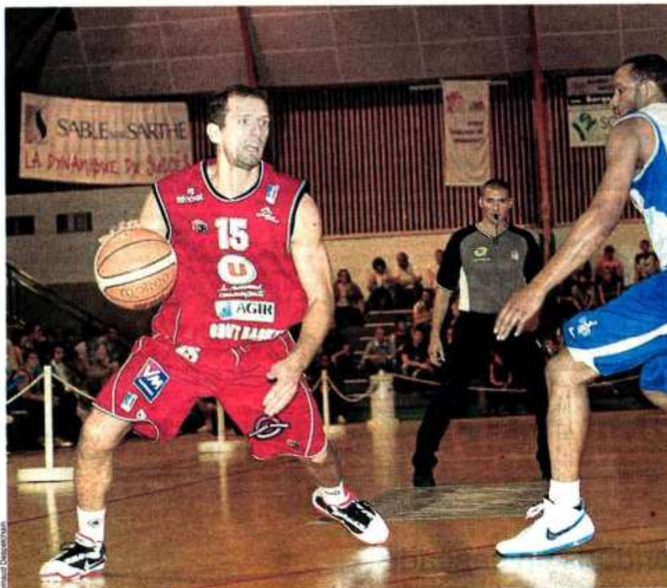
En finale du tournoi Sarthe-Pays de la Loire, Cholet a été battu par Le Mans (62-60, ap). page 4

Ouest France – Dimanche 12 septembre 2010