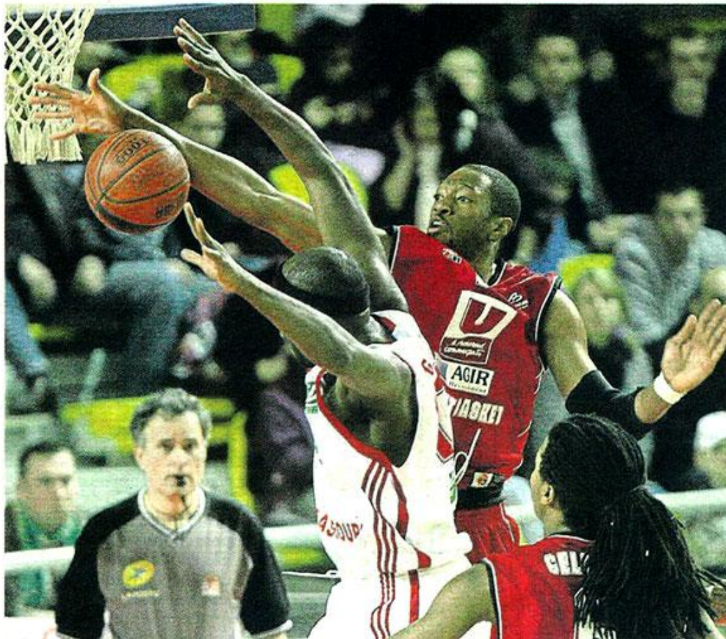
Strasbourg, Hall Rhénu, samedi. Voici l'une des rares images d'un duel intérieur puisque les Choletais ont pris leurs aises derrière la ligne à 3 points.

Qui aurait pu imaginer CB réussir 22 tirs primés à 55 % de réussite ? Pas grand monde. A la SIG, qui a dû faire sans Roberson (adducteurs) et sans Essart (torticolis), le bretzel est resté en travers de la gorge. « Sur une défense de zone, il