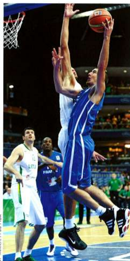
J-F Mollere / FFB FIBA