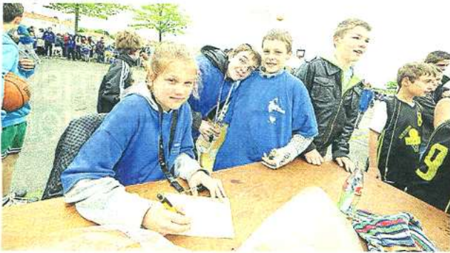
A la table de marque, les juges sont à peine plus âgés que les compétiteurs. La fête est aussi l'occasion d'apprendre aux jeunes l'art et la manière de bien arbitrer.