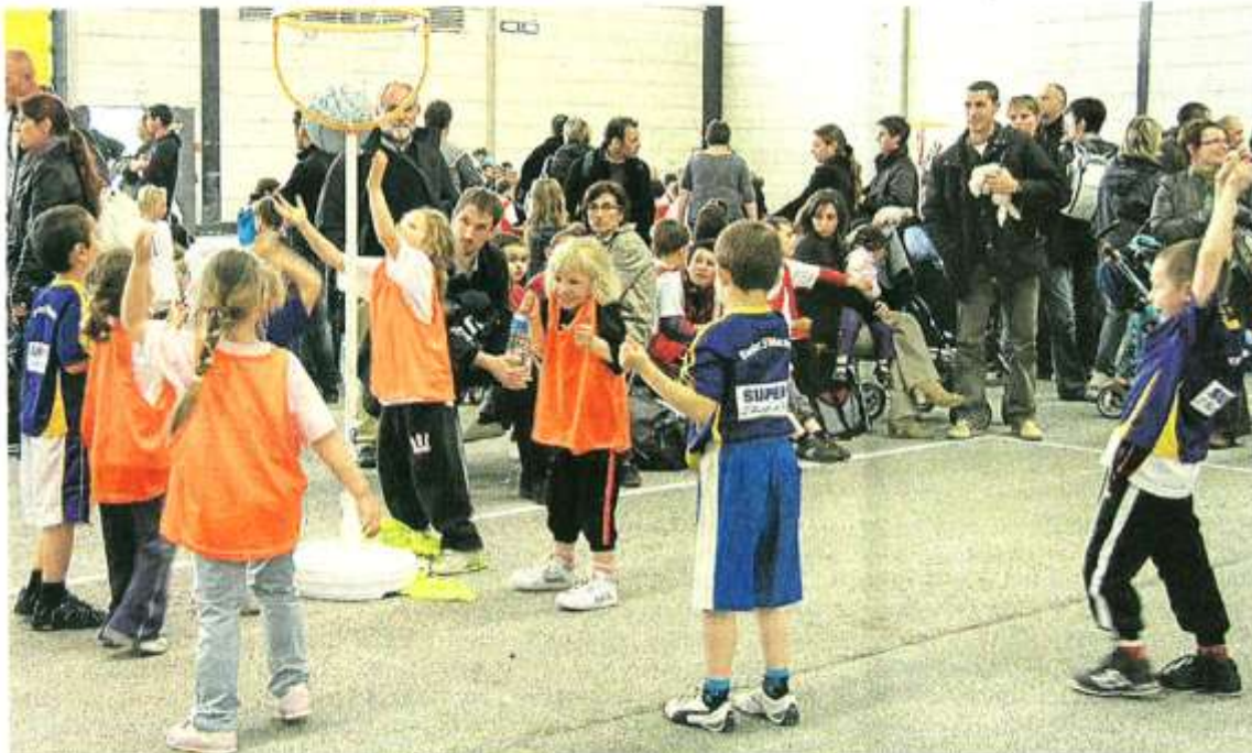
Sur 1 735 enfants âgés de 5 à 10 ans, les écoles de baby-basket ont fourni un bataillon de 269 bambins. Au total, 88 clubs sont représentés.

L'aventure du comité départemental de basket dure depuis 27 ans, grâce à l'implication des bénévoles et des familles. Pour le plus grand plaisir des basketteurs en herbe, qui jouent sur le goudron.