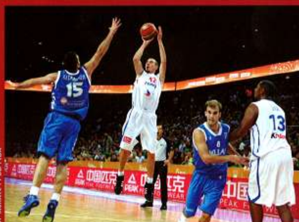
J.F. Mollere - FFBB - FIBA

▶ Lorsque Nando De Colo étrenne ses galons d'international à l'été 2008, l'Équipe de France est au fond du trou. Non qualifiés pour les Jeux Olympiques, les Bleus doivent repasser par une périlleuse phase de qualification pour l'Euro 2009. Après quelques matches amicaux, la sélection reçoit le renfort de Tony Parker. Mais lors de son premier match "officiel" c'est bien le Nordiste qui lui vole la vedette. Au terme d'une prestation offensive éblouissante, De Colo se fend de 28 unités face à la Belgique. Depuis, il n'a plus quitté le groupe France et compte 68 sélections au compteur, autant que Parker ou Boris Diaw au même âge. Lors du dernier Euro, le joueur de Valence avait sorti le grand jeu face à la Lituanie ou lors du quart de finale contre la Grèce, contribuant largement à la conquête de la médaille d'argent. Un résultat qui a provoqué un formidable élan de sympathie vis-à-vis de l'Équipe de France : "C'est toujours comme ça, dans n'importe quel sport ou dans la vie en général, quand ça se passe bien, on oublie tout. Il vaut mieux penser au futur de toute façon. Moi j'avais fait quatre campagnes en Équipe de France sans rien gagner... Et je trouvais ça long. Alors j' imagine pour ceux qui sont là depuis 10 ans. Donc j'étais vraiment content pour eux. Le secret c'est la continuité. Moi j'ai connu une quarantaine de coéquipiers en Équipe de France. Maintenant que le groupe commence à être bien établi, on pourra repartir encore plus fort." ■