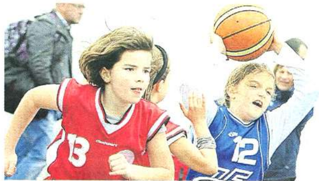
Les jeunes talents s'exercent et les joues deviennent de plus en plus rouges au fil des matchs. Sur la touche, les parents encouragent leurs enfants.