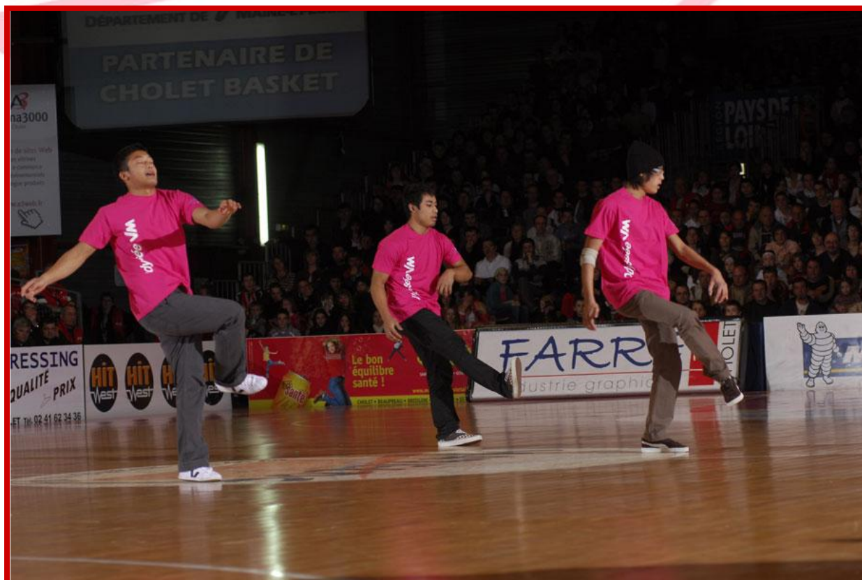
Les danseurs de l'Association Hip Hop Choletaise étaient habillés aux couleurs du parrain du match, VM MATERIAUX.