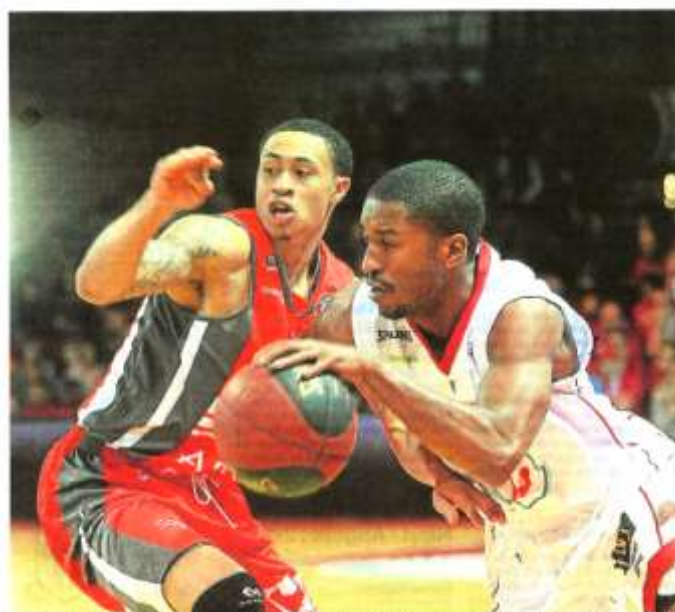
Les Choletais ont lourdement chuté contre Chalons-sur-Saône, leur défense a pris l'eau (85-104). page 10