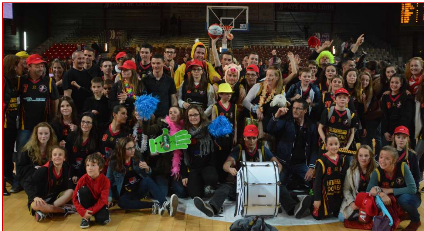
CLUB KORRIGANS (35) Club le plus dynamique