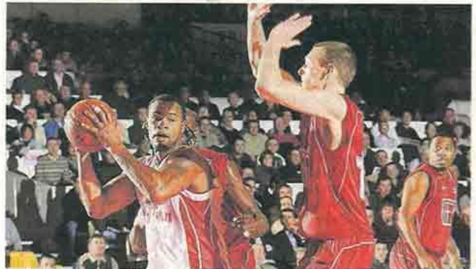
Les basketteurs choletais rencontreront leurs homologues allemands le 24 février, et les Strasbourgeois le 27 février.

Tarifs : de 9 à 21 €. Jeunes 16-18 ans et étudiants : 6 €. Enfants 4-15 ans : 3 €.