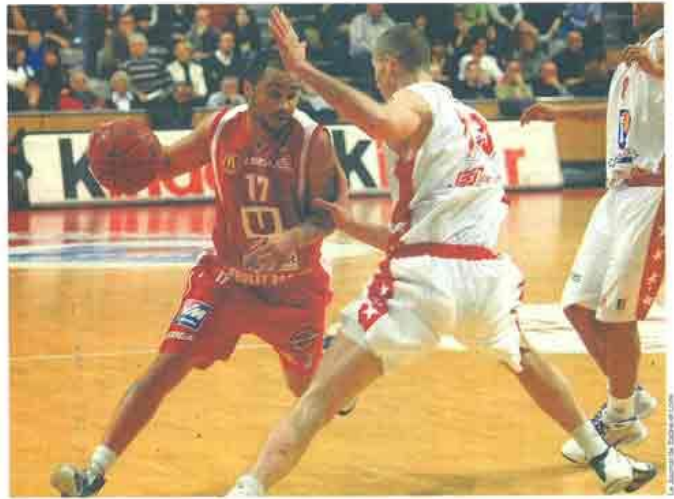
Braswell et les Choletais se sont inclinés, hier soir. Pas de huitième succès consécutif pour les hommes de Kunler.