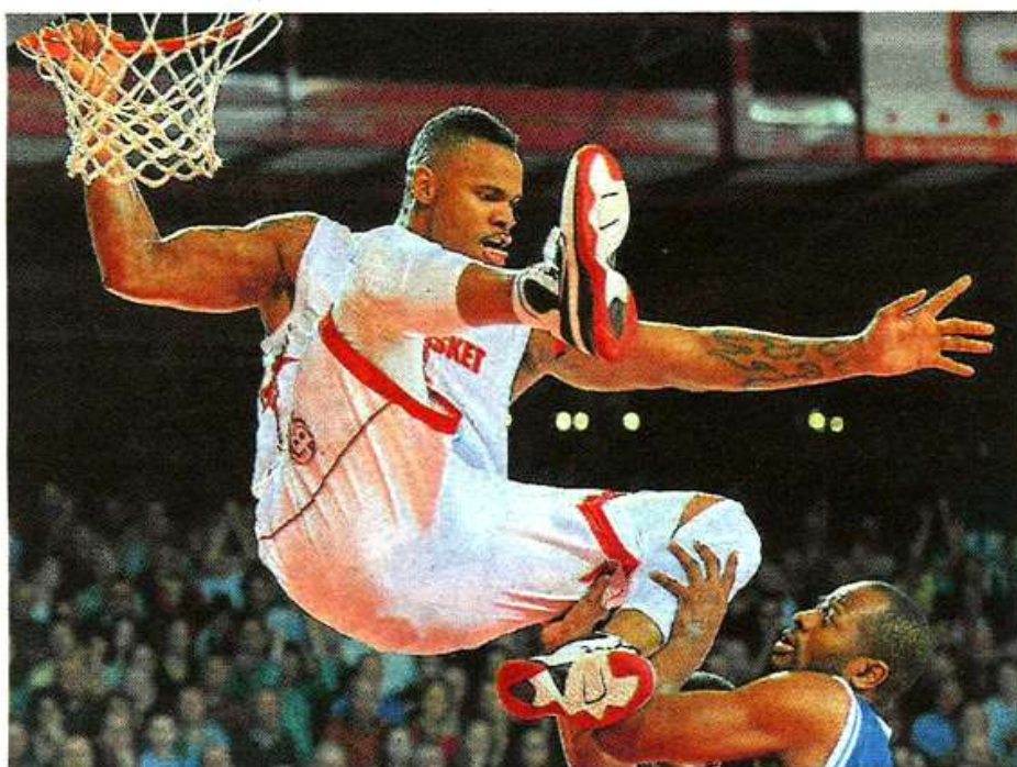
Marquis et les Choletais ont réalisé une grosse performance face à Roanne.

Arbitres : MM. Betton, Guedin et Jeanneau. ANTIBES : Blue (12), Fein (5), De Jong (16), Solomon (12), Winston (11), Vebobe (2), Desroses (3), Ona Embo (3), Bryan-Amaning (7). DIJON : Moss (8), Riley (10), Harris (9), Dobbins (12), Campbell (14), Prenom (12), Traore (2).