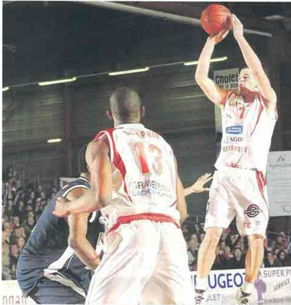
Cholet, La Meillerie, hier. Larrouquis, peu utilisé ces derniers temps, a placé CB sur la voie du succès grâce à son adresse.

rencontres toutes compétitions confondues, les Choletais poursuivent effectivement leur marche en avant. Hier, cet investissement à temps partiel a suffi à faire déraiper une équipe rouennaise « orpheline au poste de meneur. »