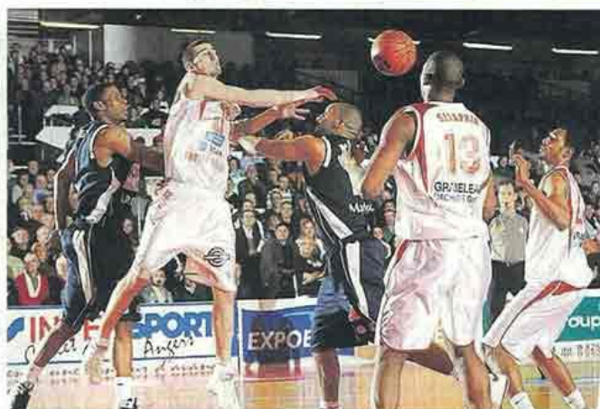
Cholet, la Meilleraie, hier. Nando De Colo (de face) a apporté sa pierre à l'édifice du succès choletais en inscrivant 15 points.

Le Courrier de l'Ouest- Dimanche 8 février 2009