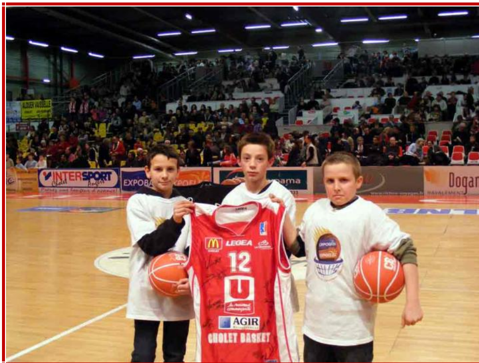
Les jeunes du Pomjeannais basket club ont remporté ce challenge et repartent avec un maillot dédié et des ballons de CB.