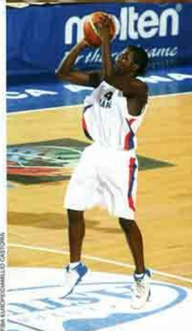
FIM EUROPE/MELLO CASTORINI