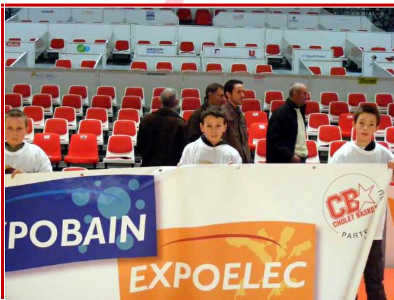
MontJean sur Loire et La Pommeraye