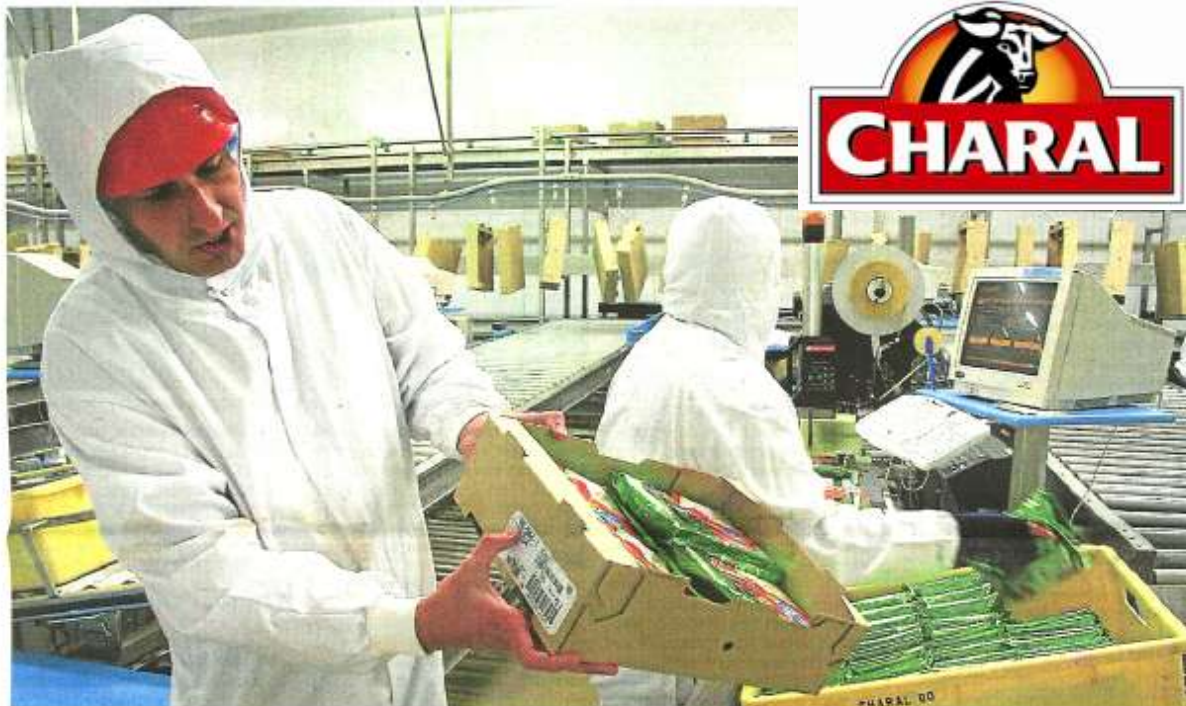
Charal abat près de 80 000 animaux par an dont la moitié provient de la région. La viande est destinée à des plats cuisinés, du steak haché, ou est conditionnée en packs déclinés en diverses gammes.

Il n'y a pas que les exploitants agricoles qui sont présents au Salon de l'agriculture. La société Charal y tient un stand où elle peut expliquer aux curieux son travail et l'origine de ses approvisionnements.