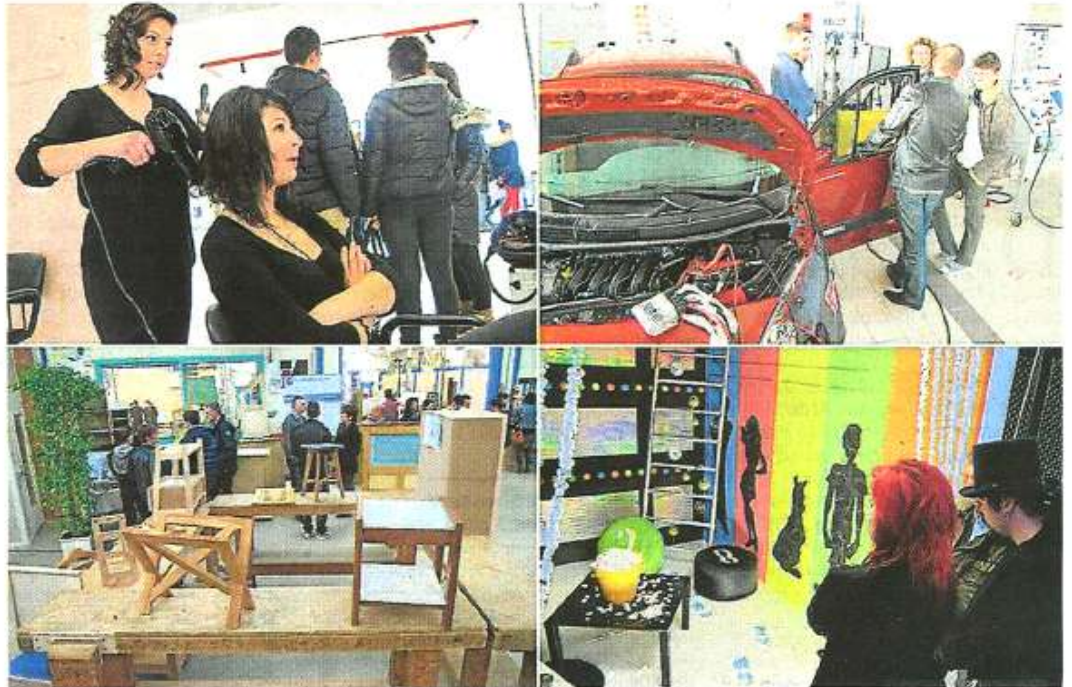
Cholet, Eurespace, hier. Les candidats à l'apprentissage ont découvert des métiers, un bâtiment et des outils innovants.