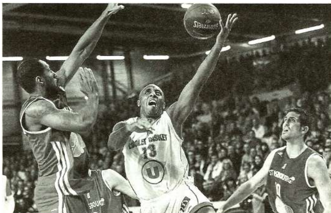
En sortie de banc, Chatfield a enfin retrouvé des sensations. Au meilleur moment, pour permettre à CB de battre Strasbourg.

Pour viser l'exploit, il reste donc 10 matches à CB. Dix rencontres pour tenter de donner un peu plus de saveur à un exercice 2013-2014 jusque-là délicat. « Dix journées, ça laisse un peu de temps, un peu de place », poursuit Buffard, si on joue comme contre Strasbourg, c'est motivant et encourageant. « Contre la SIG, CB a fait preuve d'une adresse exceptionnelle dans le premier quart-temps (69 % de réussite). Ça ne lui arrivera pas tout le temps, c'est sûr. Mais le point intéressant, c'est que l'équipe ne s'est pas désunie dans la suite du match, comme elle en avait la fâcheuse habitude ces derniers temps. Résultat, Strasbourg est resté à distance raisonnable malgré une petite frayeur. Et Cholet a gagné. « On avait été un peu réducteurs sur les derniers matches », explique Buffard, en référence aux défaites subies par son équipe, la faute à une mauvaise gestion des fins de rencontres, alors que ses joueurs avaient plutôt dominé leur sujet (Olaj en Eurochallenge, Roanne en coupe de France). « Il faut avoir cette même envie. Cette volonté de défendre ensemble et de partager le ballon tout le match. » Un message qui commence visiblement à passer auprès du groupe. « Si on garde la même intensité, la même envie, et qu'on a