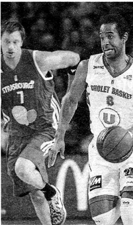
Cox et les Choletais se sont logiquement imposés face à Strasbourg.

ROANNE : Amagou (11), Morley (14), Sangare (8), English (7), Samnick (8), Green (5).