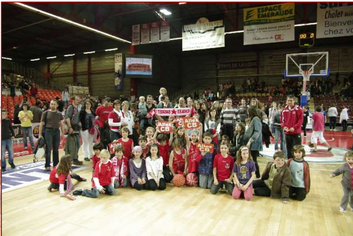
BASKET SEVRE MAINE a été élu LE CLUB LE PLUS DYNAMIQUE